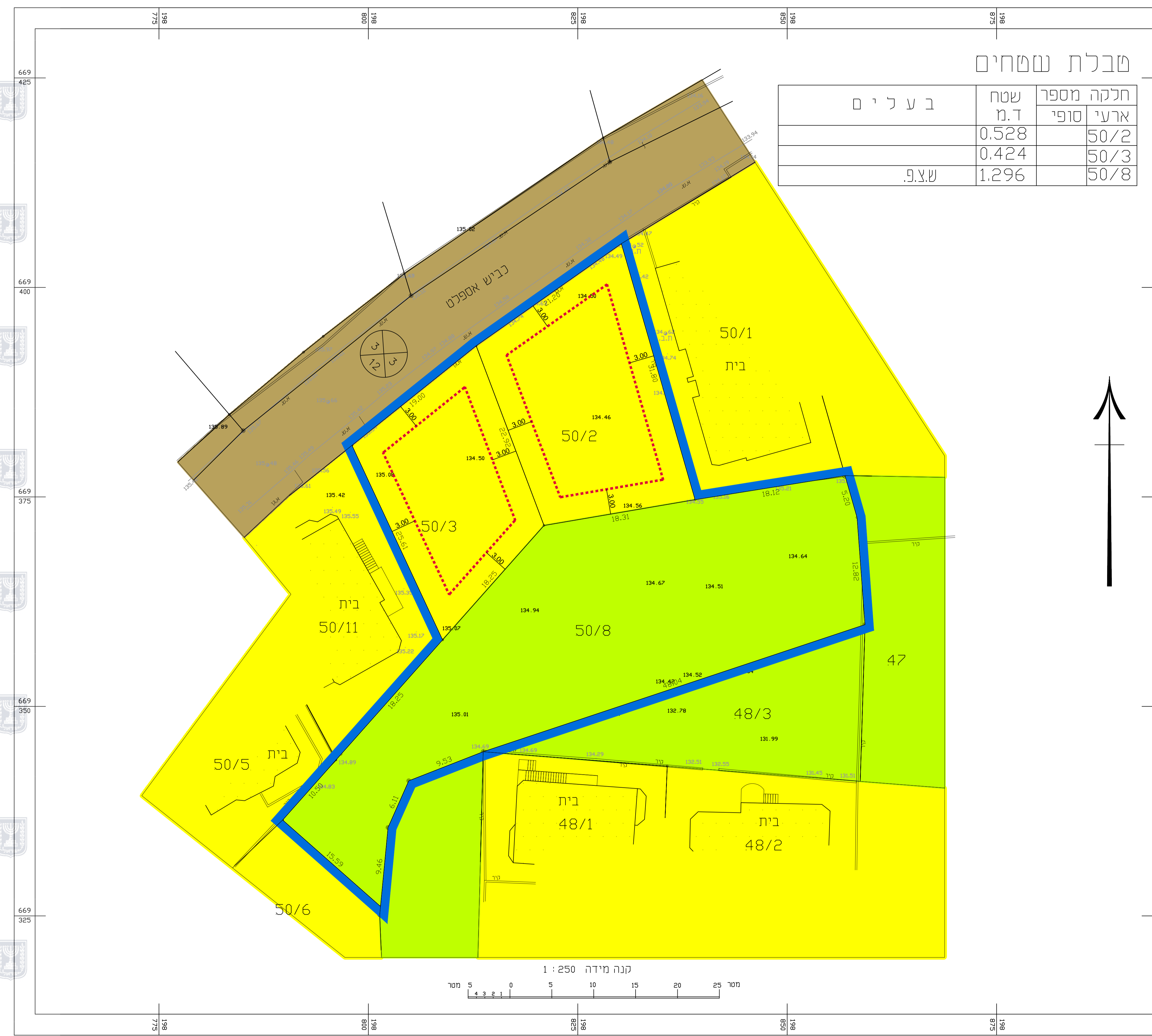
מצב מאושר קנ"מ 1 : 250 לפי תכנית 1/3000 ק"מ