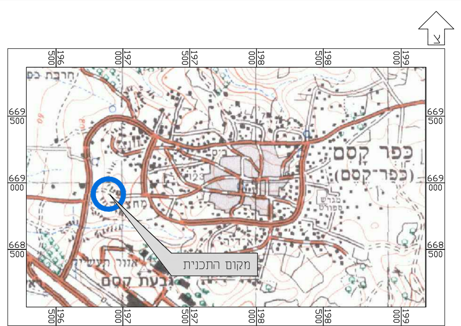
תרשים להתמצאות כללית קנ"מ 1 : 25000