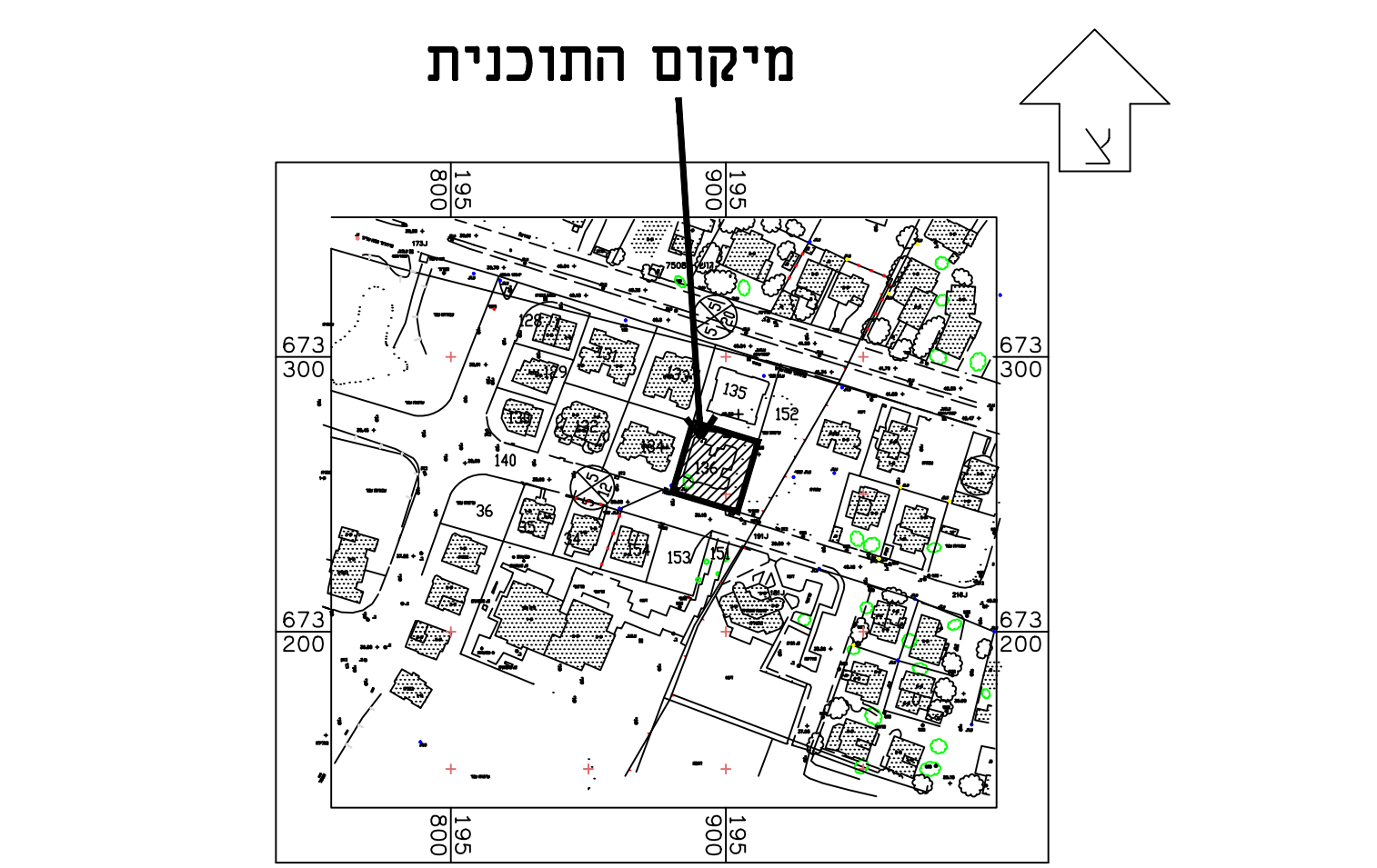
תרשים לסביבה הקרובה קנ"מ 1:2500