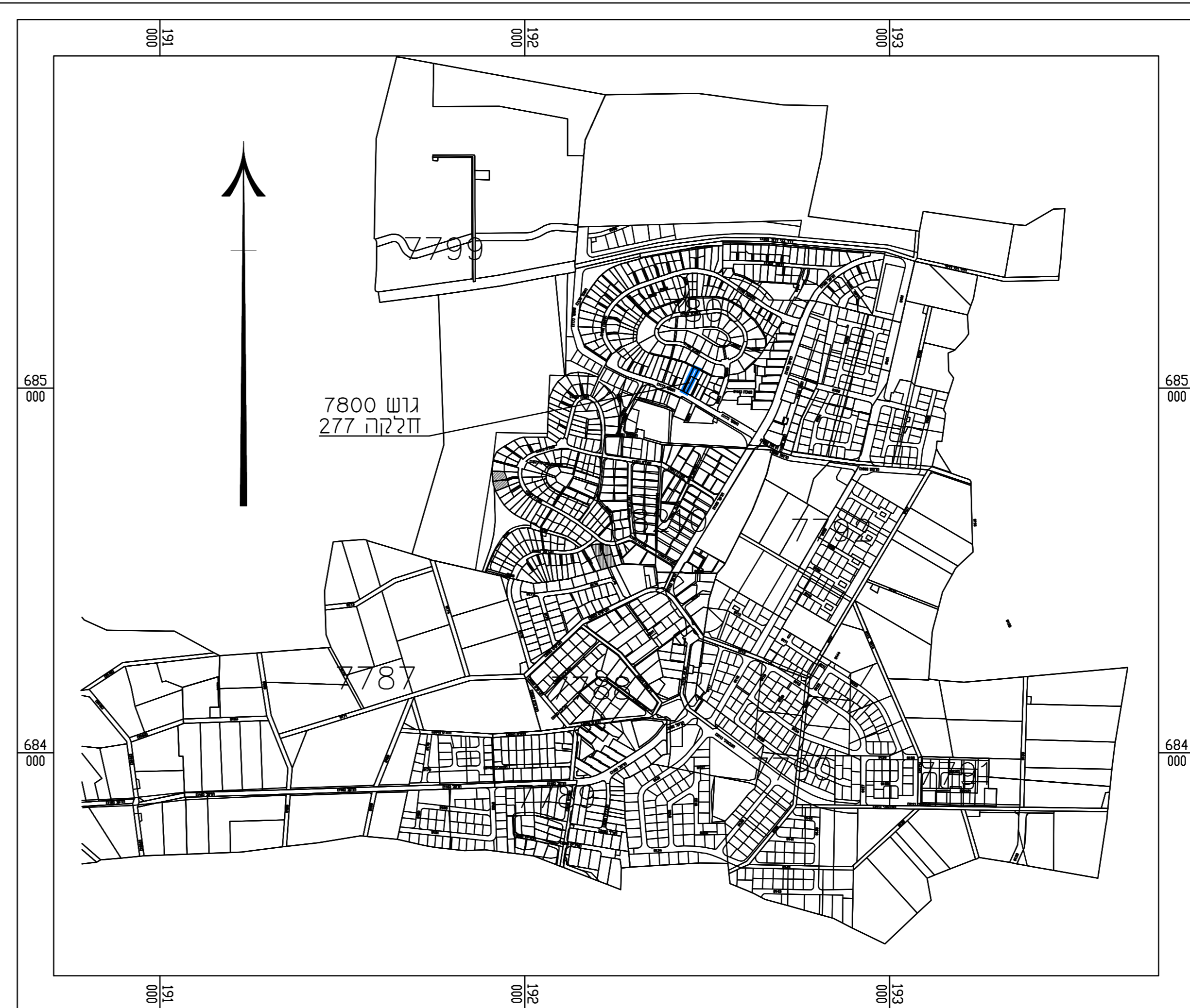
תרשים התמצאות כללית קנ"מ 1:10000