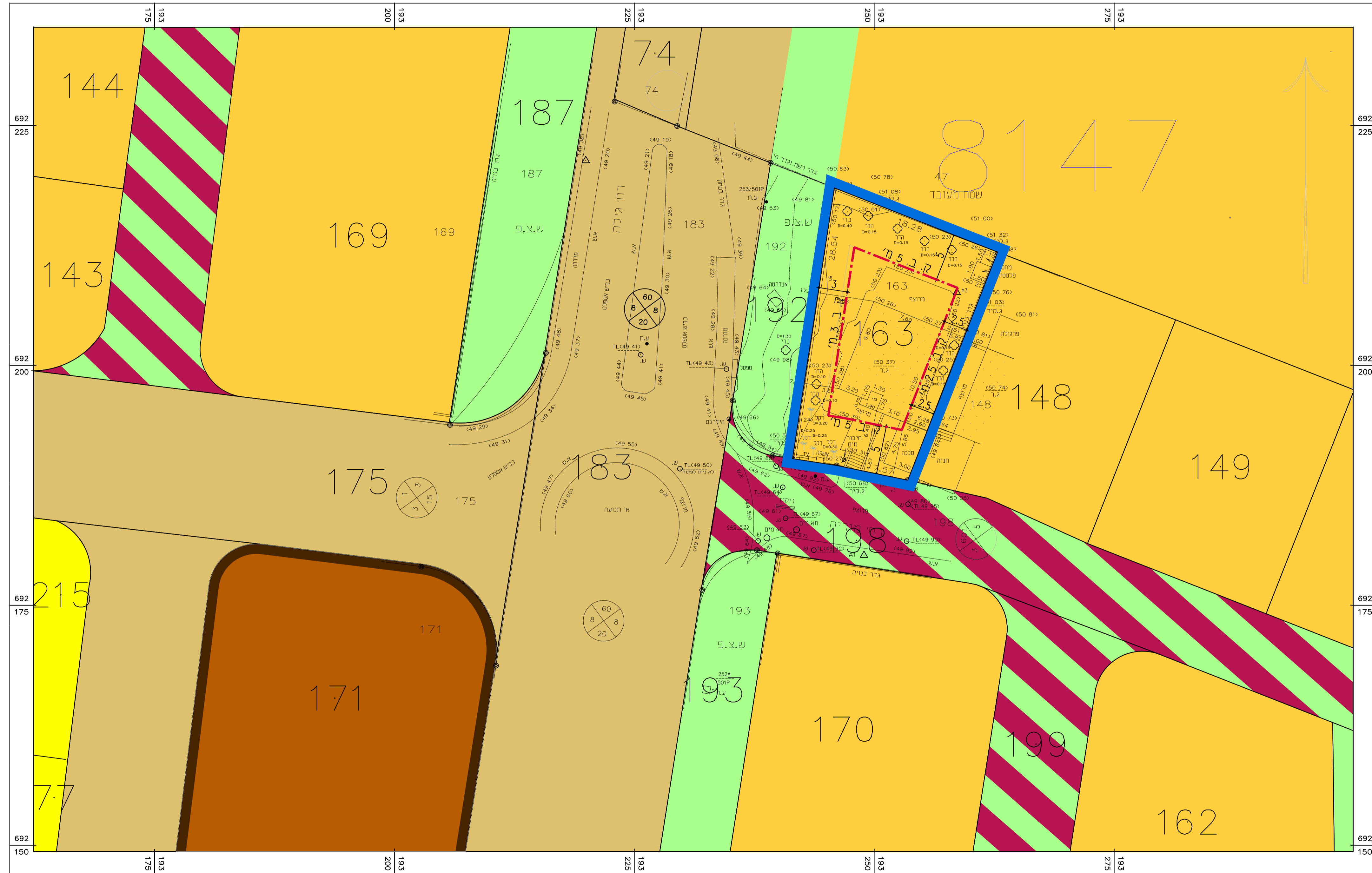
מצב מאושר קנ"מ 1:250