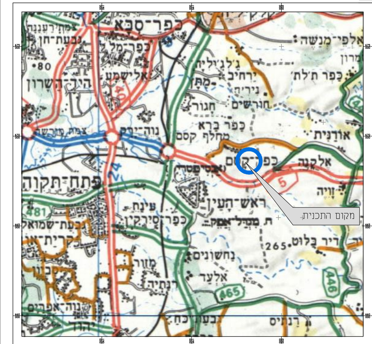
תרשים להתמצאות כללית קנ"מ 1 : 50000