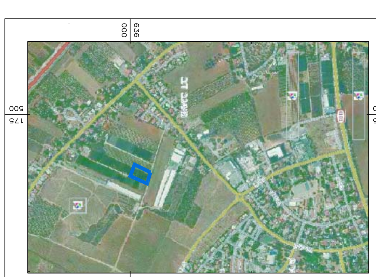
תרשים התמצאות קו"מ 1:10000