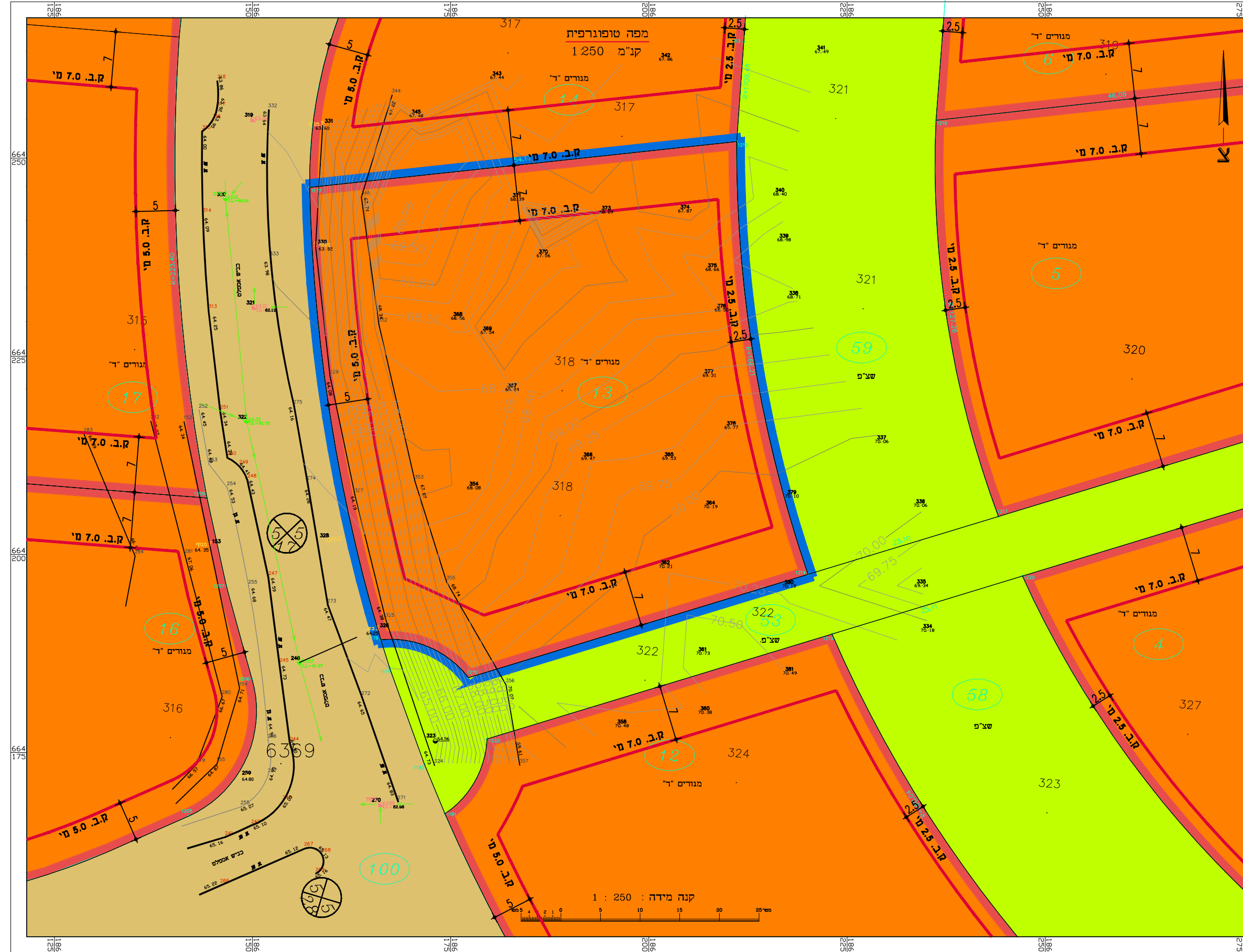
מצב מאושר קנ"מ 1 : 500