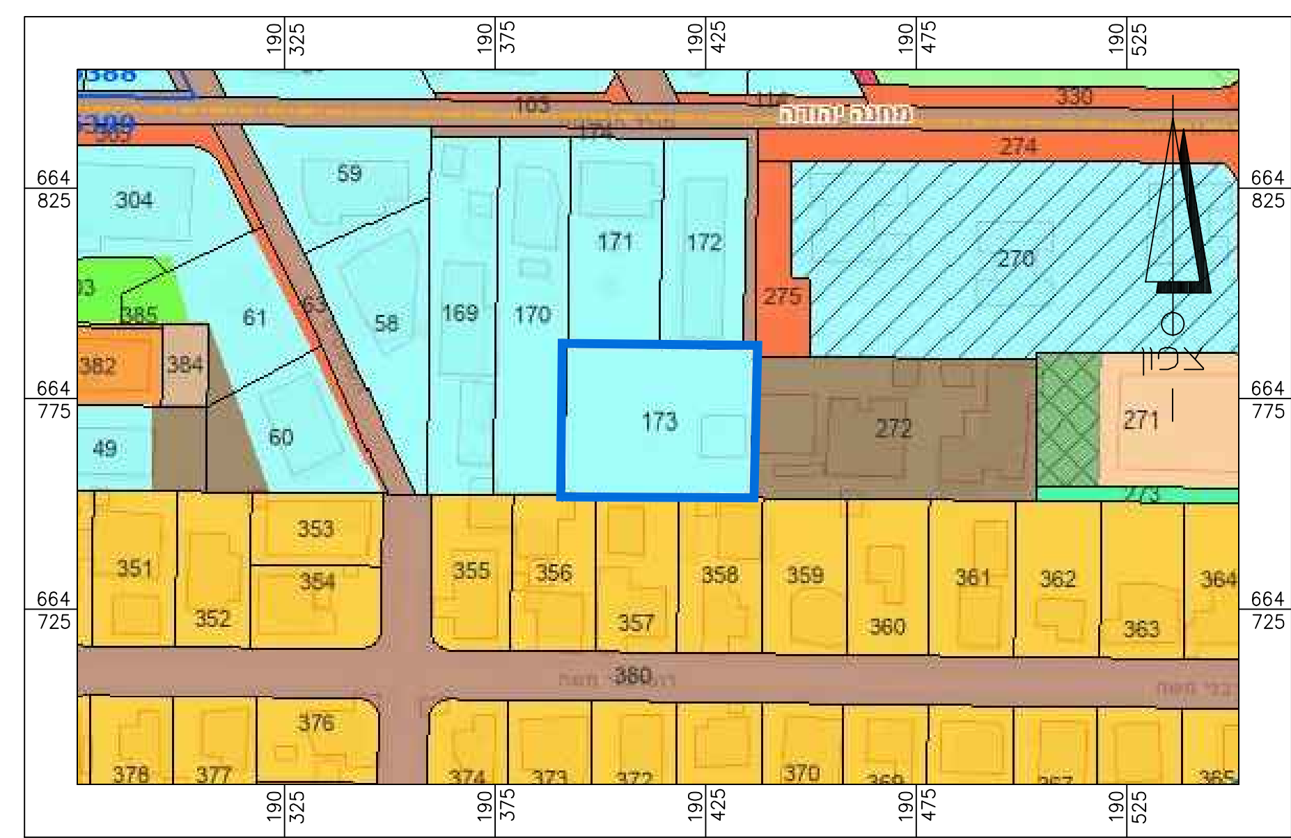
תרשים סביבה קרובה - 1:250