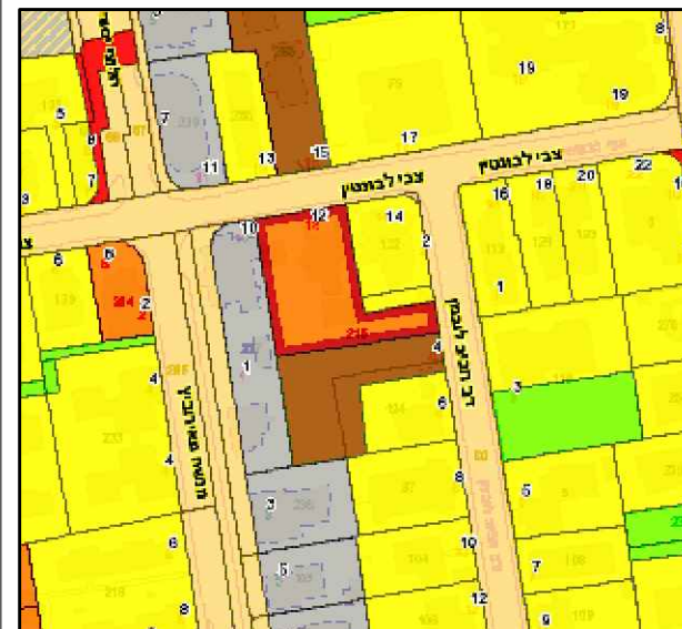
1:2500 תרשים סביבה