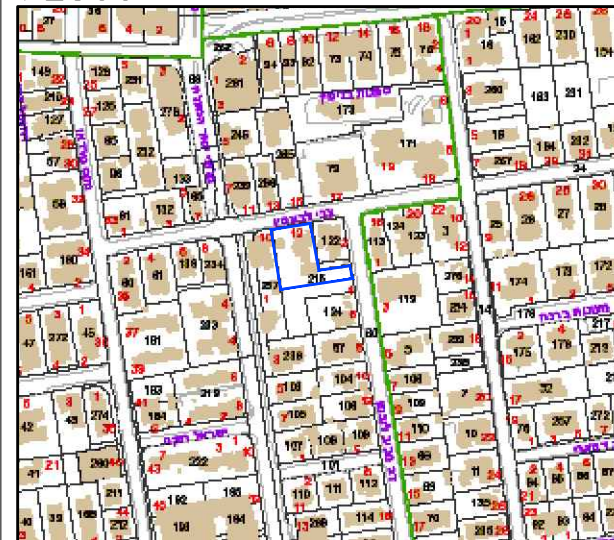
1:5000 מפת התמצאות