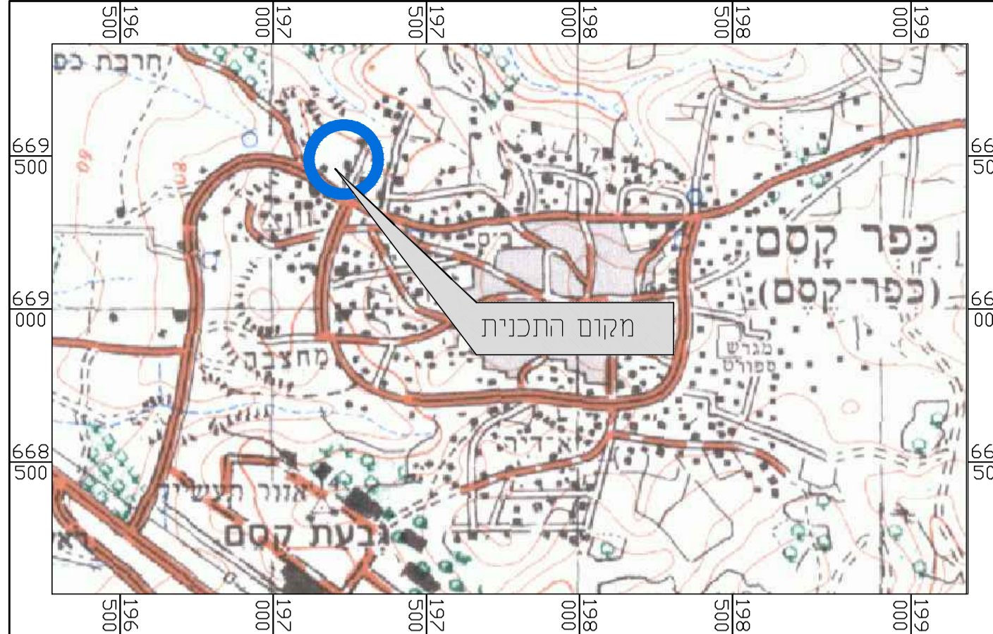
תרשים להתמצאות כללית קנ"מ 1 : 25000