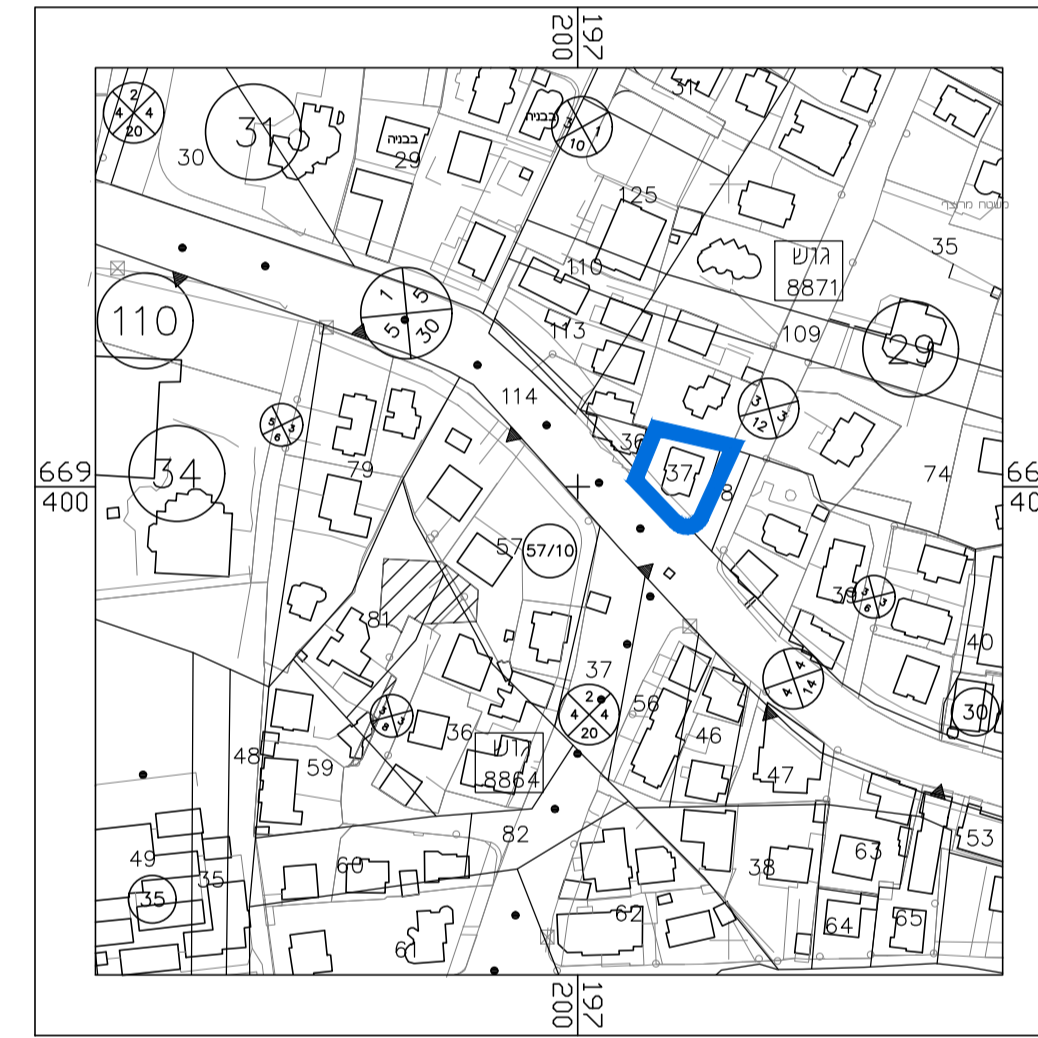
תרשים לסביבה הקרובה קנ"מ 1 : 2500