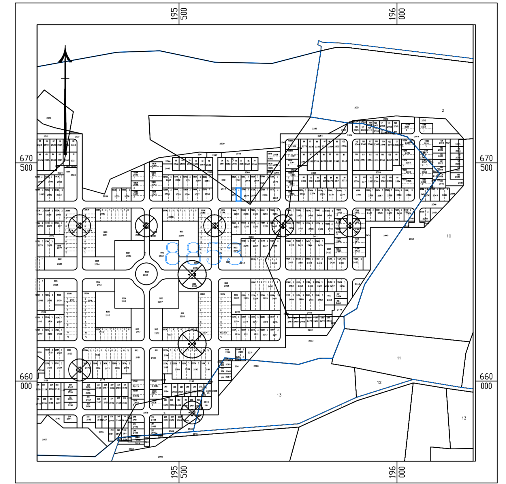
תרשים התמצאות כללית קנ"מ 1:5000