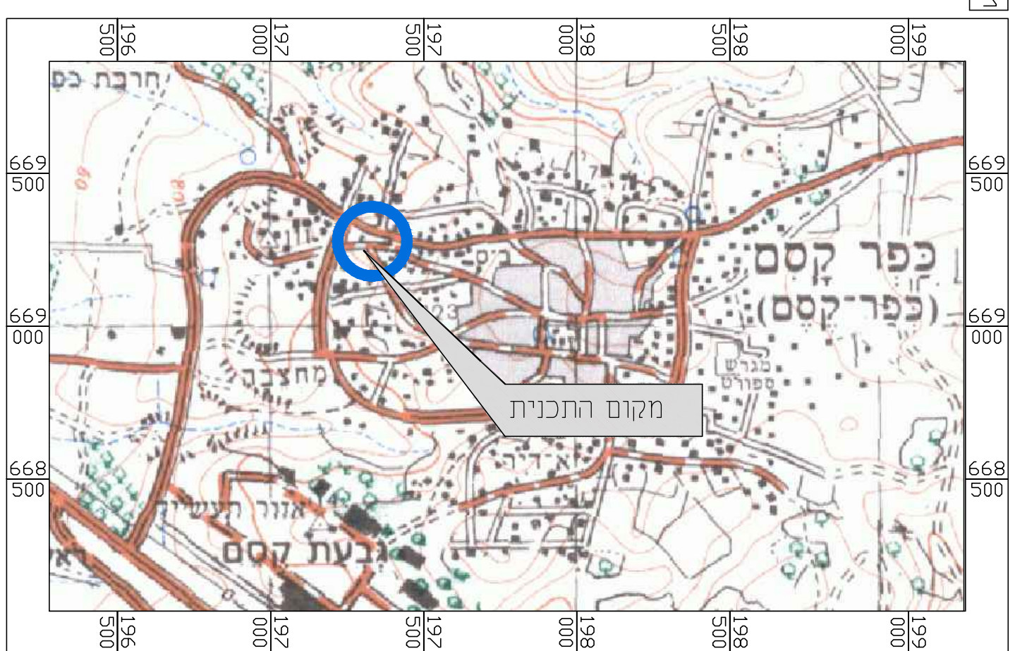
תרשים להתמצאות כללית ק"מ 1 : 25000