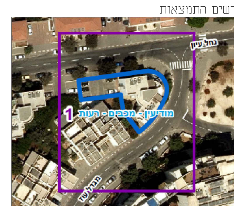
שנת צילום אוויר: 2017-2018