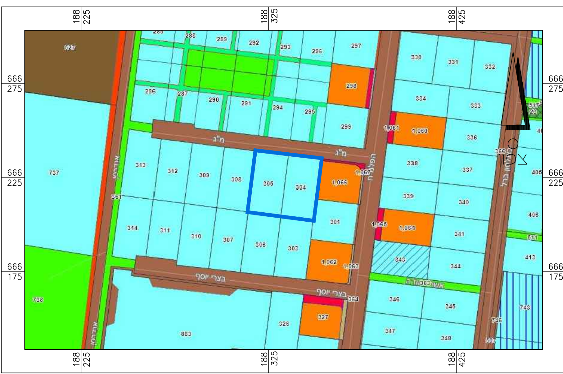
תרשים סביבה קרובה - 1:250