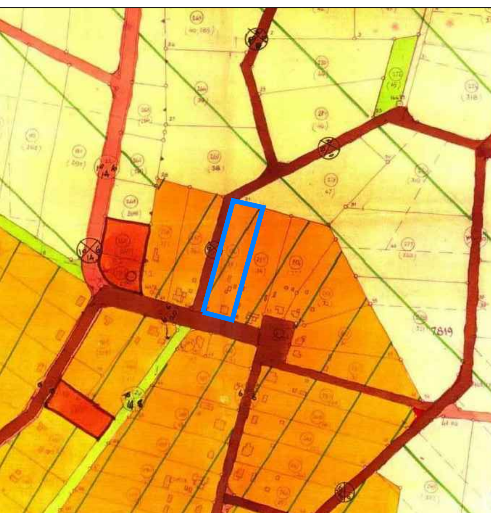
תרשים סביבה קנ"מ 1:2500