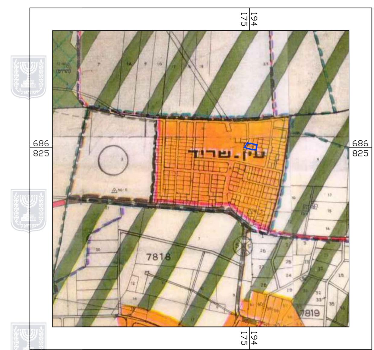
תרשים התמצאות ע"פי צש\ס\ל\ס קנ"מ 1 : 10,000