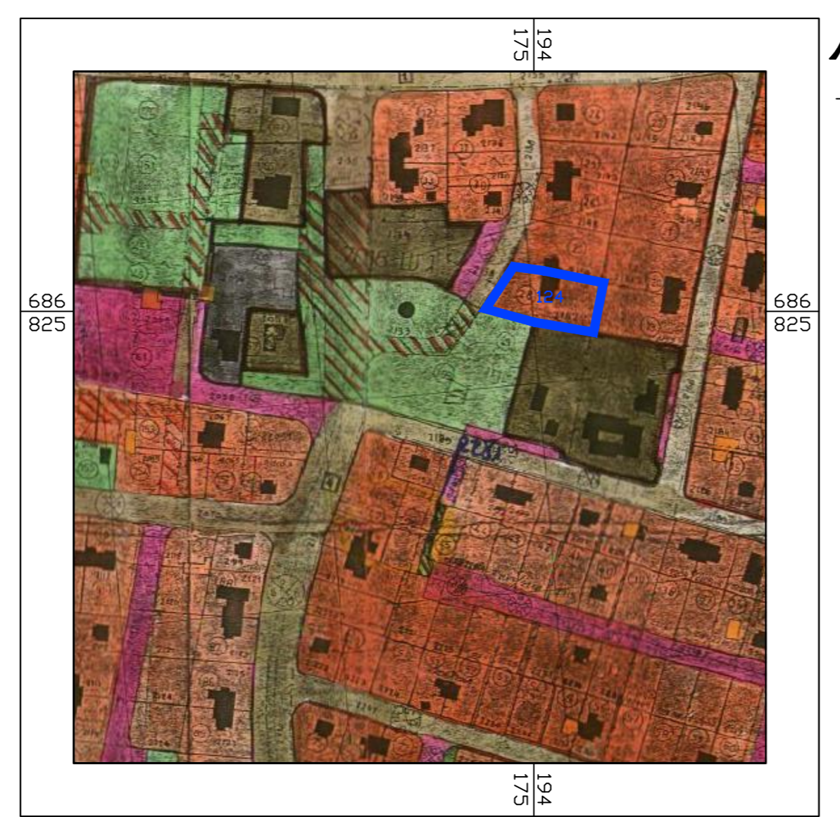
תרשים התמצאות ע"פי צש\ס\ל\ס קנ"מ 1 : 2,500