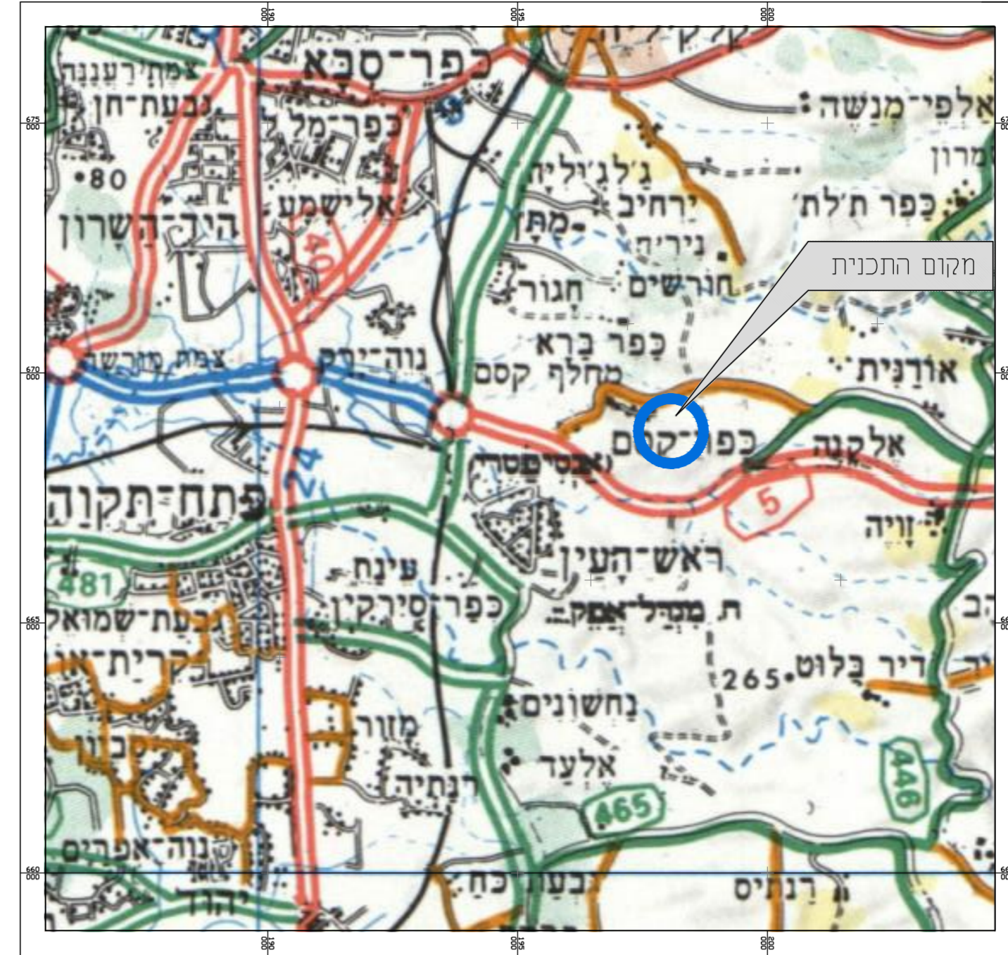
תרשים להתמצאות כללית קנ"מ 1 : 50000