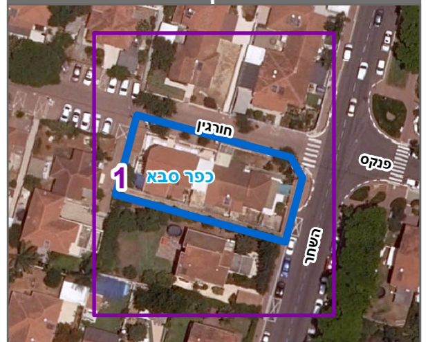
שנת צילום אוויר: 2019