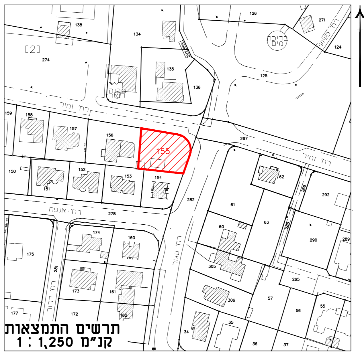
תרשים התמצאות קנ"מ 1:1,250