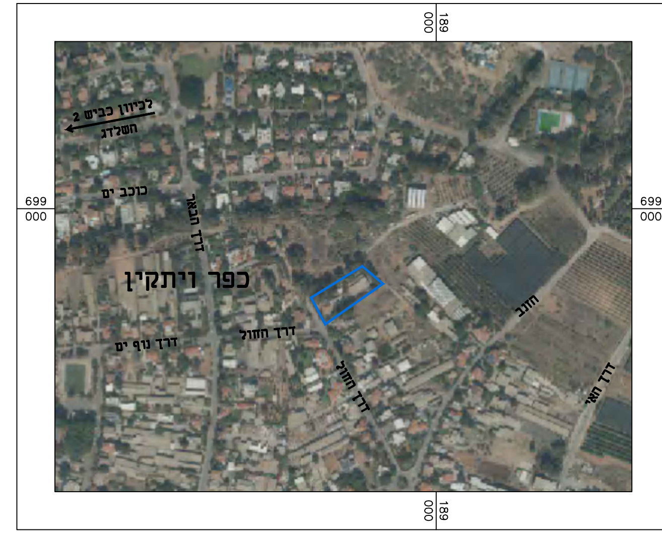
תרשים התמצאות 1 : 5000