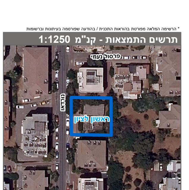
שנת צילום אוויר: 2019