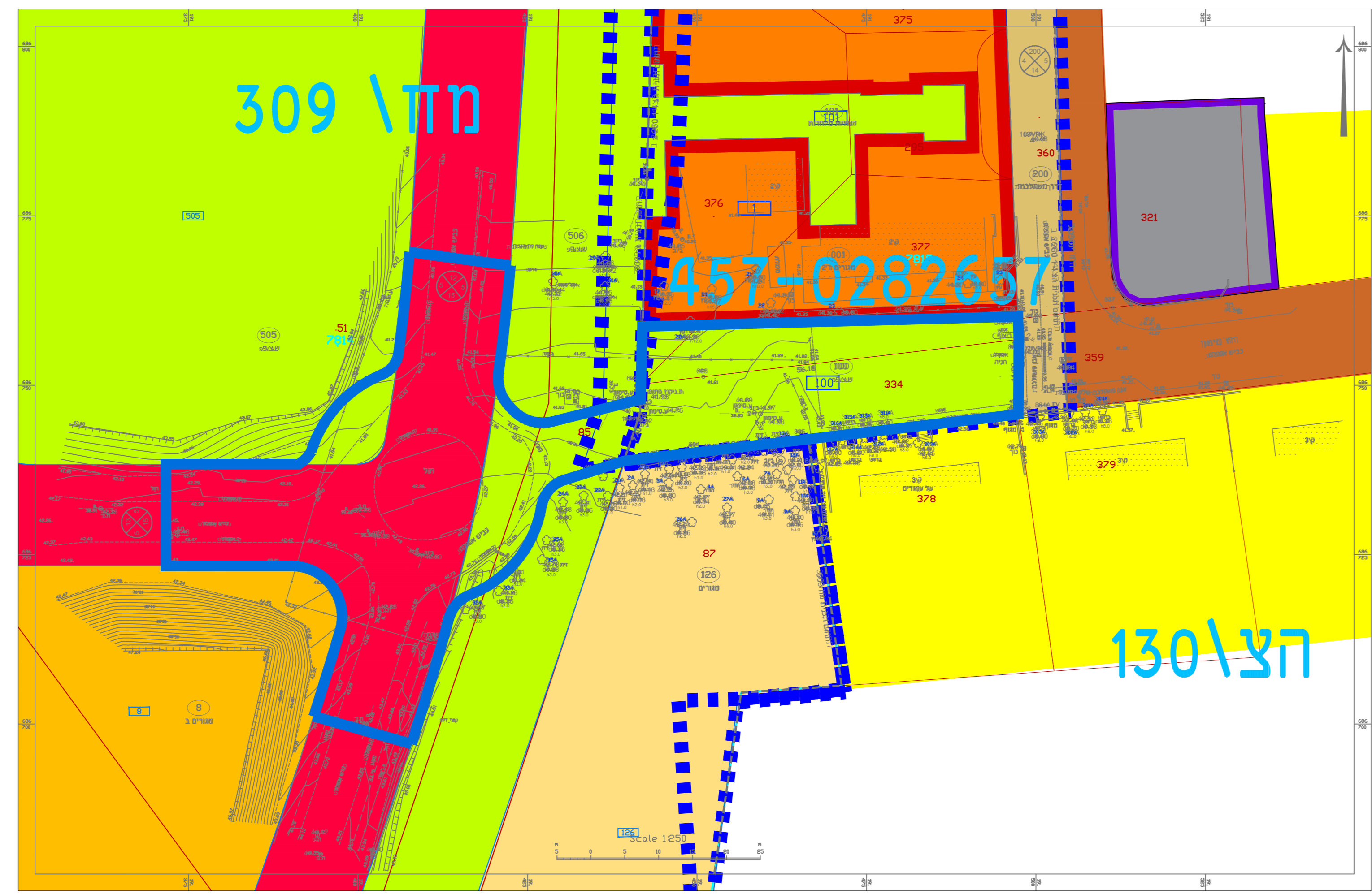
מצב מאושר קני"מ 1 : 500