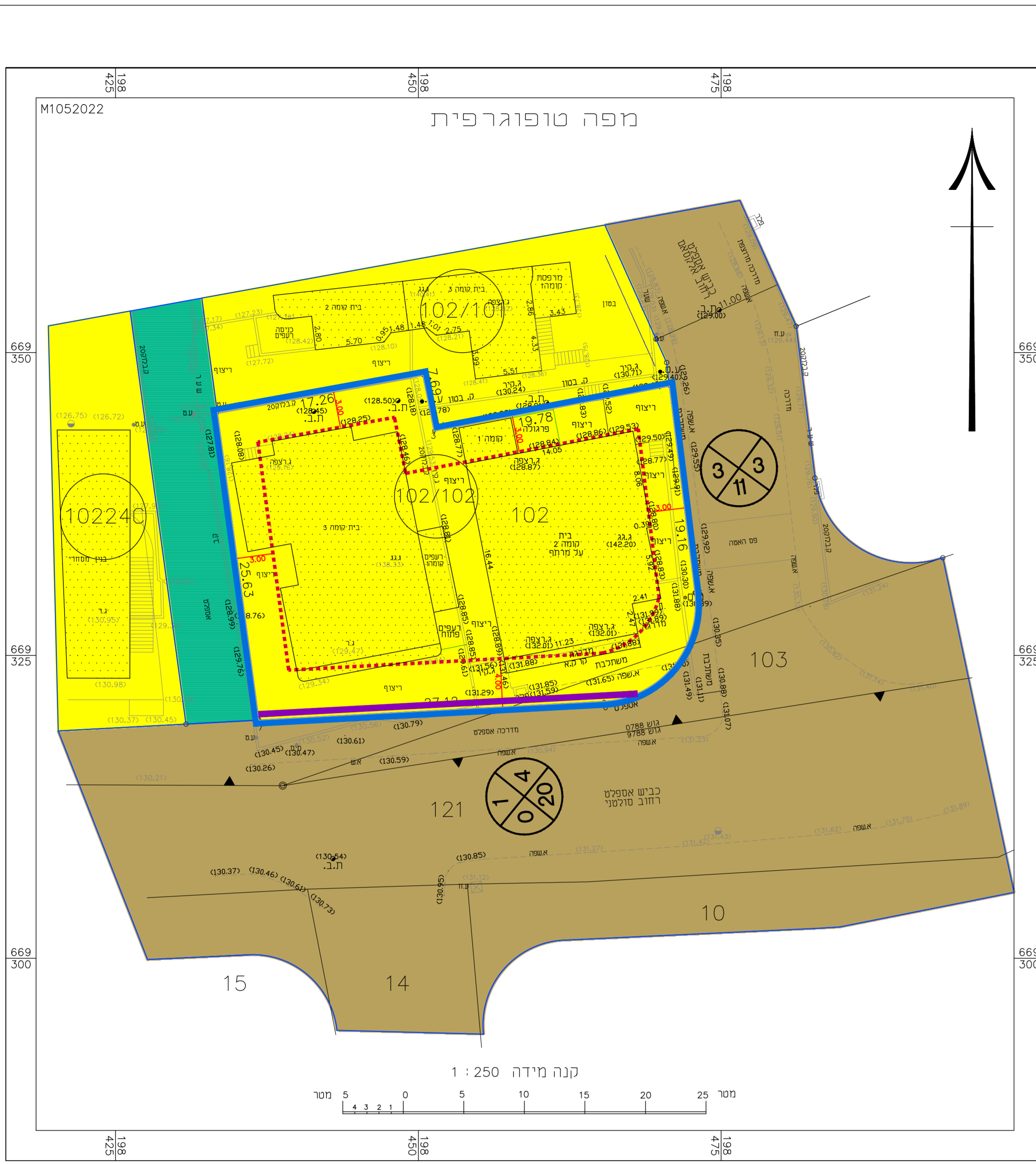
מצב מאושר קנ"מ 1 : 250 לפי תכנית ק/3000