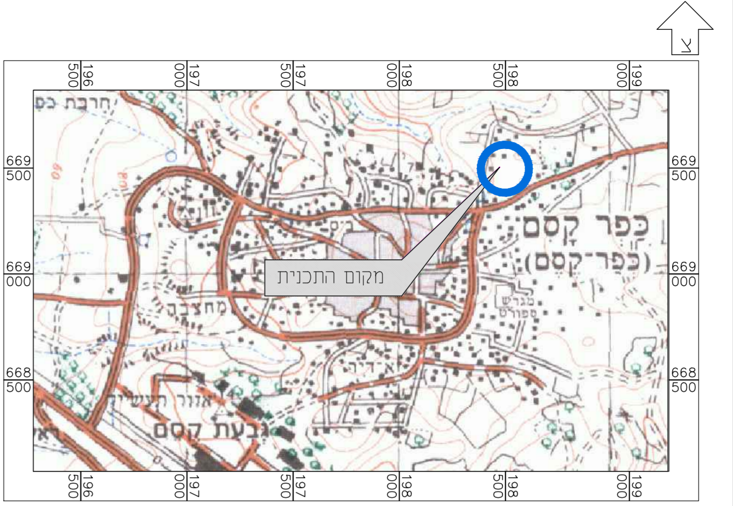
תרשים להתמצאות כללית קנ"מ 1 : 25000