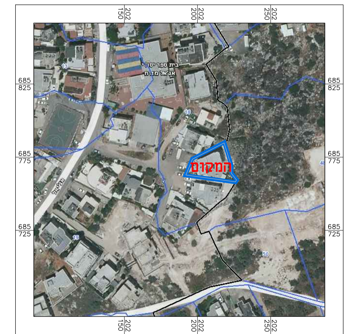
תרשים הסביבה הקרובה קנ"מ 1:1250