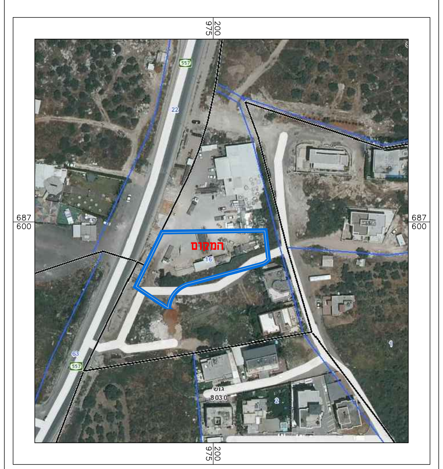
תרשים הסביבה הקרובה ק.מ. 1:1250

חוק התכנון והבנייה, התשכ"ה - 1965 תכנית מפורטת מס' 402-1133412 איחוד וחלוקה מחדש וקביעת קווי בניין פואד גבאלי