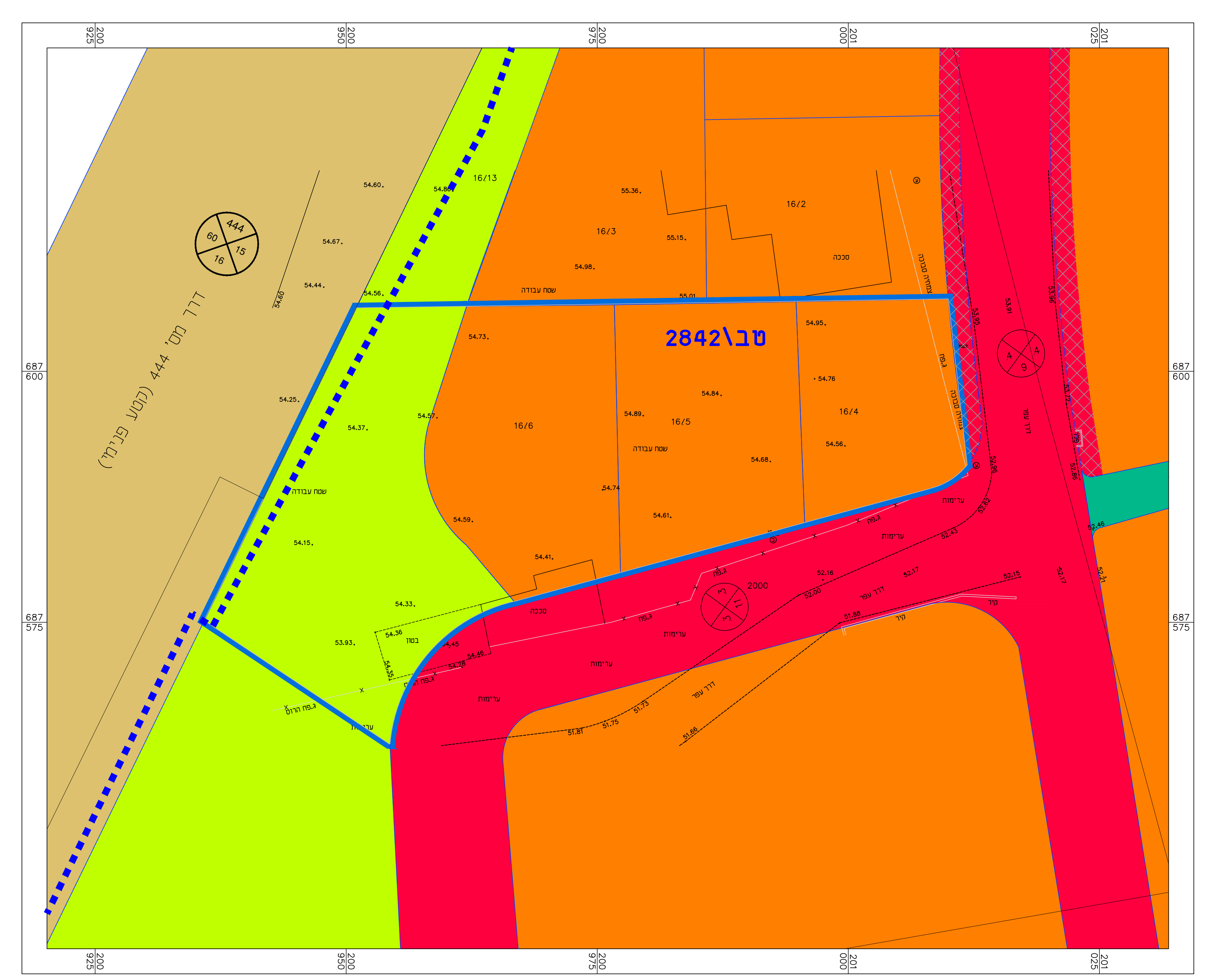
מצב מאושר קנ"מ 1:250 עפ"י תכנית טב/2842