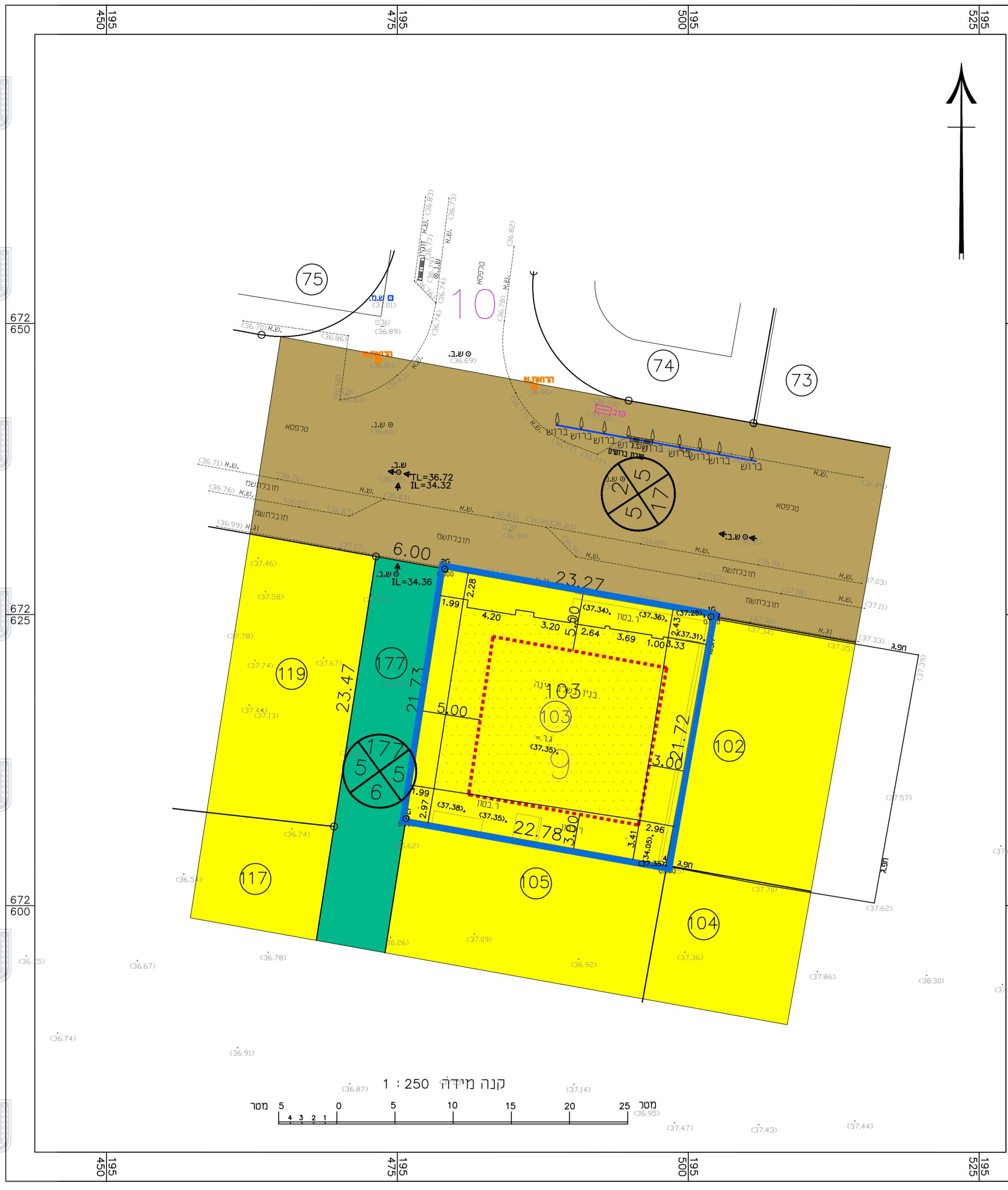
מצב מאושר קני"מ 1 : 250 לפי תכנית ק/3036/1

אני מאשר כי מפה זו הוכנה ונערכה בקנה מידה 1:250 והיא העתק נכון של המפה הטופוגרפית על סמך מדידה שטחית/מדידת ביום 10.1.2022. דרגת דיוק אפס היא 3. דרגת דיוק אנכי היא 3. המפה הוכנה לפי האמור: דרגת דיוק אפס היא 3. דרגת דיוק אנכי היא 3. המפה הוכנה לפי חקנת המדידות מדידות ומפוי. החשיב-2016. תאריך גמר התכנית 10.1.2022. גיוסי עבד אלתונם 926 חתומה שם המודד ומענו מספר רישון חתומה כתובת - גלגוליה 158/9 רח' 45850 טלפון - 03-9396001 טלפקס - 03-9744882 כתובת מייל - o.j1969.serv@gmail.com אתר אינטרנט - https://www.obedjayosi.co.il/