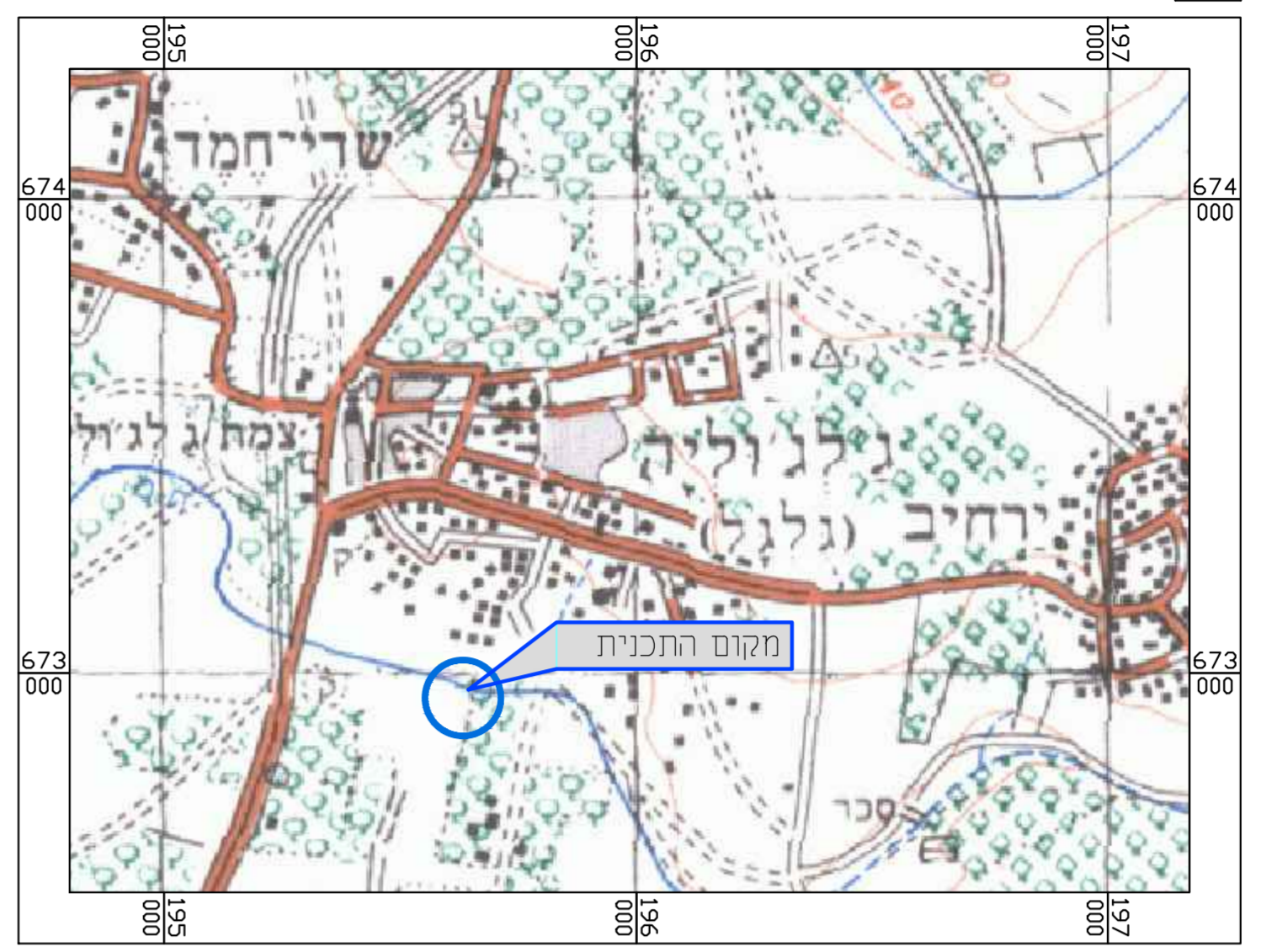
תרשים התמצאות כללית קני"מ 1 : 25,000