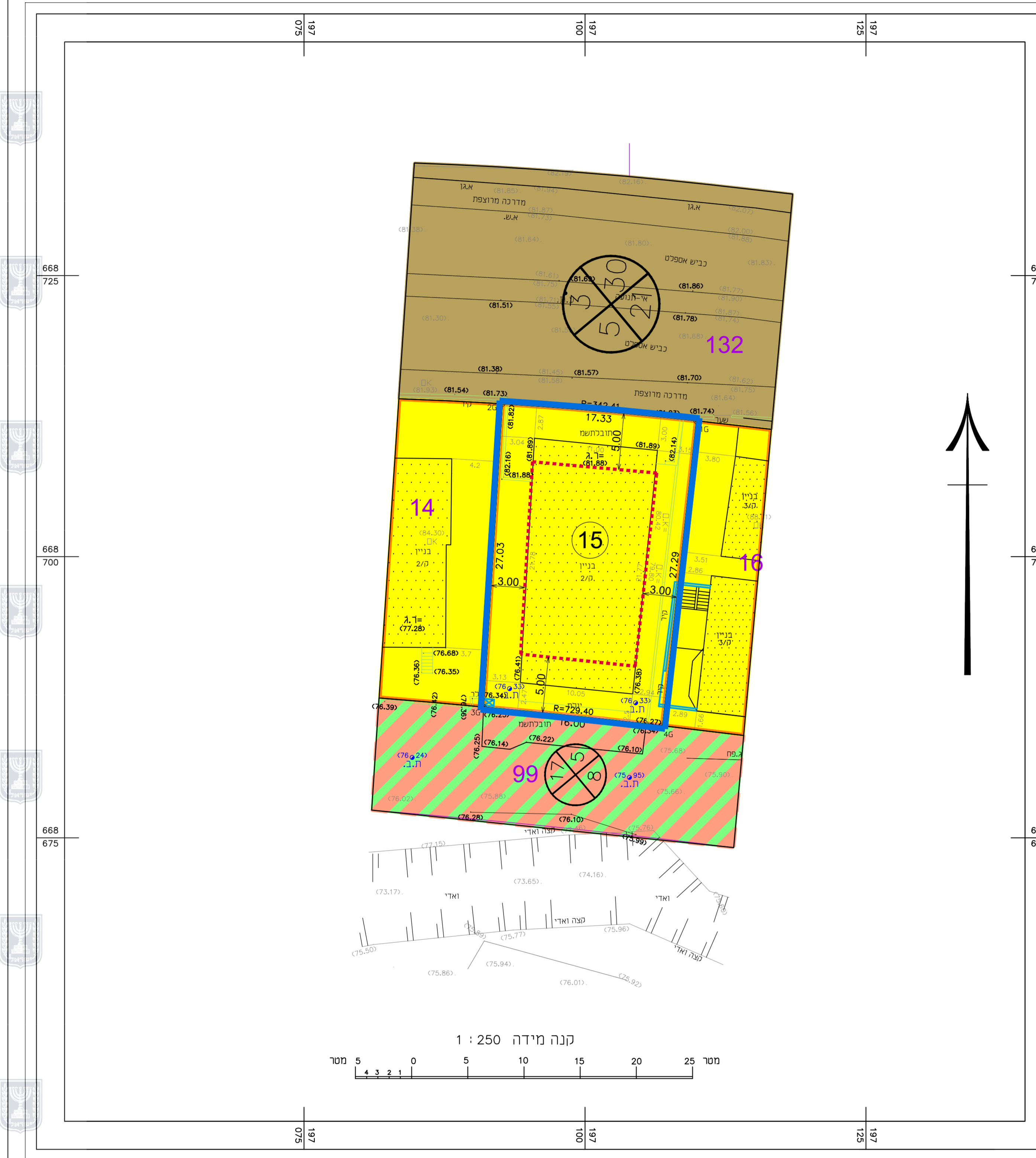
מצב מאושר קנ"מ 1 : 250 לפי תכנית 7/ק