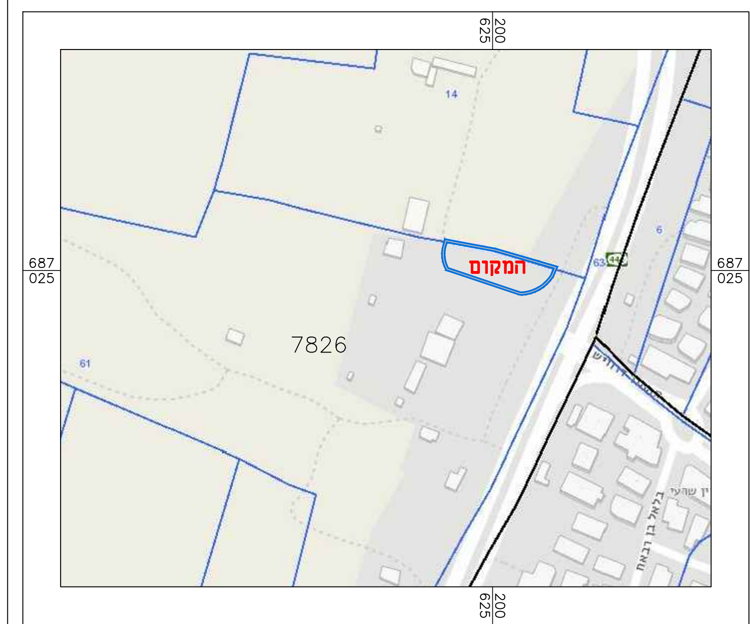
תרשים הסביבה הקרובה קנ"מ 1:2500

חוק התכנון והבנייה, התשכ"ה - 1965 תכנית מפורטת מס' 402-1129519 חלוקת מגרש לשני מגרשים נאשף קיים