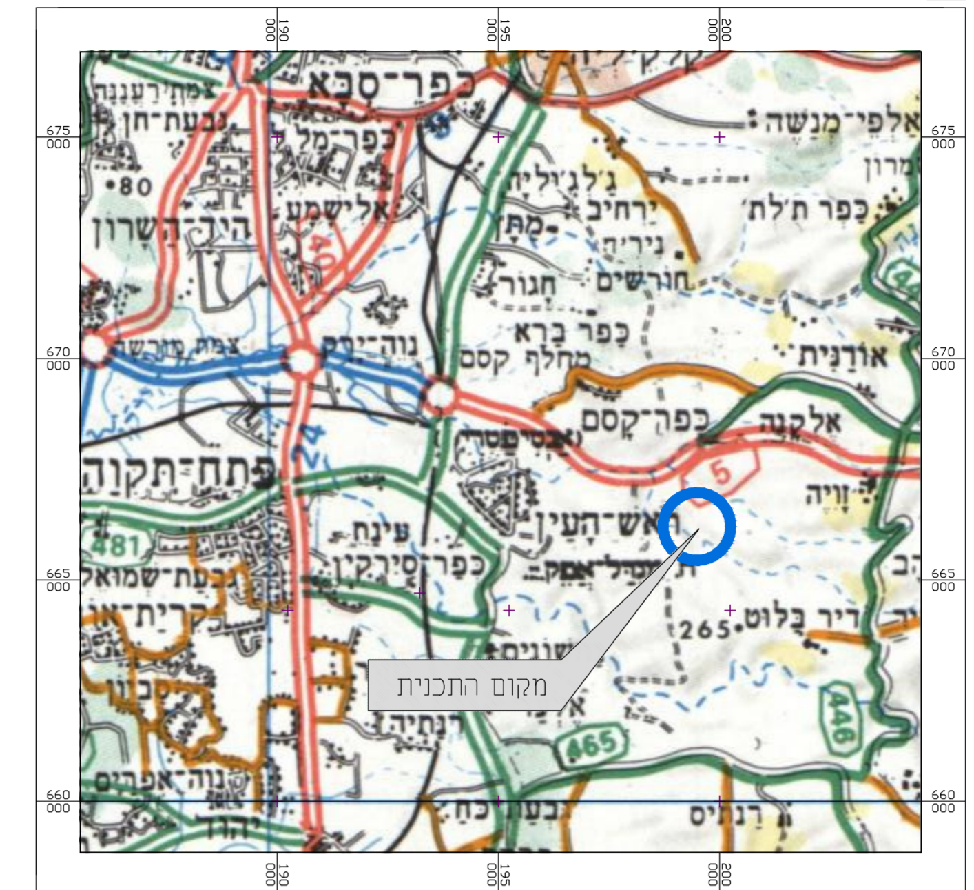
תרשים להתמצאות כללית קנ"מ 1 : 25000