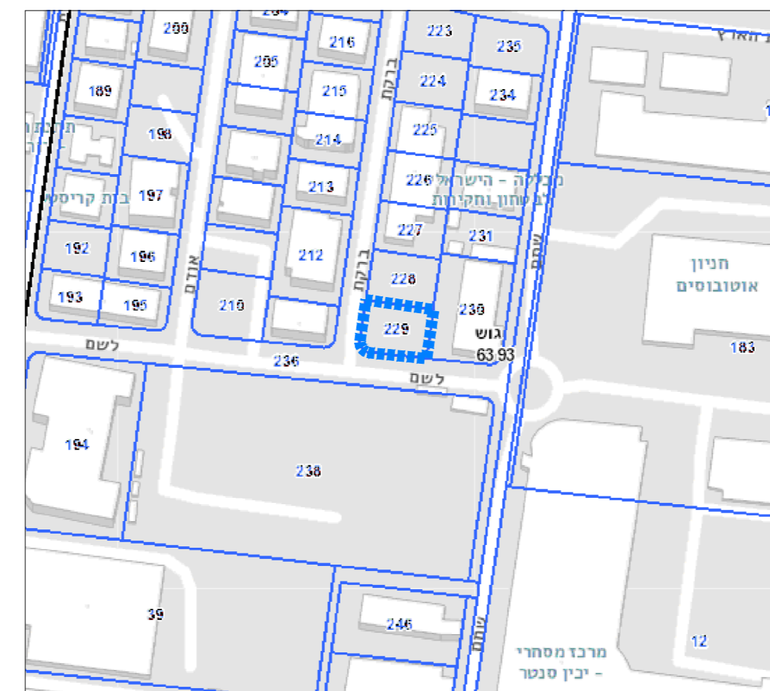
מהאטר ההנדסי של עיריית פתח תקווה תרשים סביבה קנה מידה : 2500 : 1