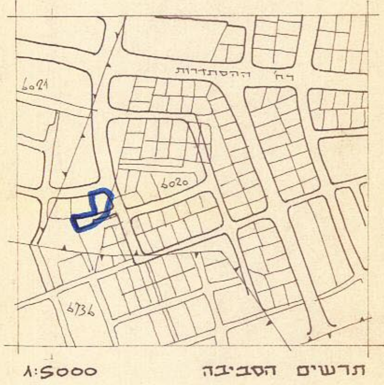
תרשים הסביבה 1:5000

משרד הפנים חוק התכנון והבניה תשכ"ה-1965 מחוז תל-אביב מרחב תכנון מקומי תכנית מס' 171/ח הועדה המחוזית כשיבתה ה מיום 26.2.67 החלטת הוועדה לעיל סגן מנהל ליוני לתכנון חשב ראש הועדה