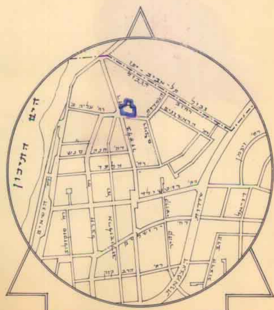
תרשים הסביבה 1:10.000