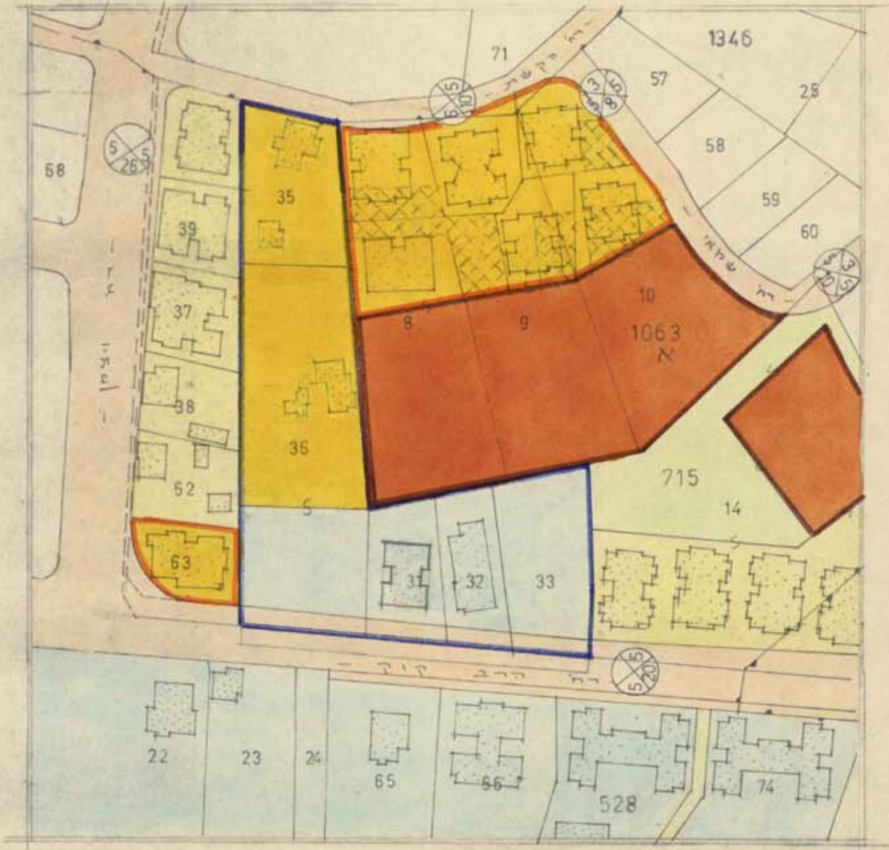
מצב קיים ק.מ. 1:1250 לפי תכנית מתאר א/253