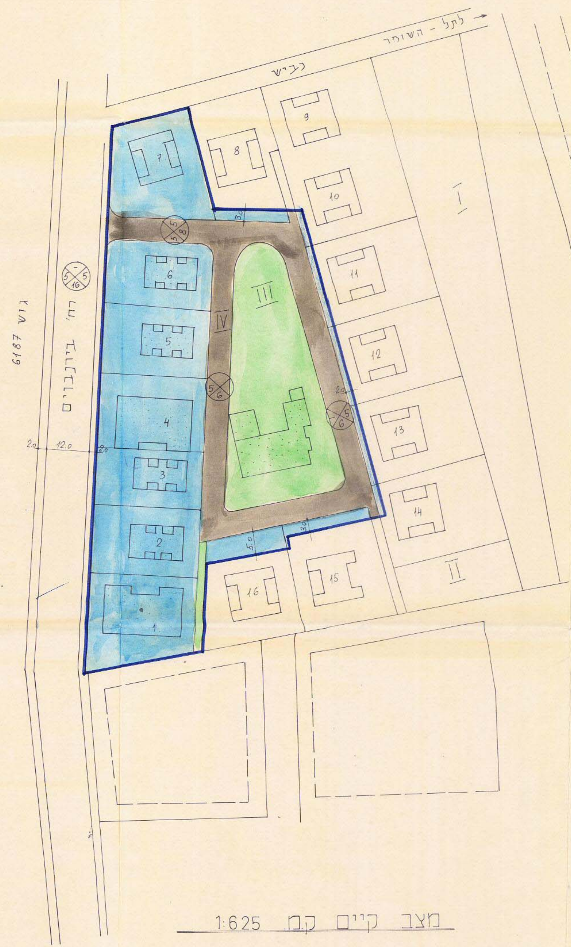
מצב קיים קמ 1:625