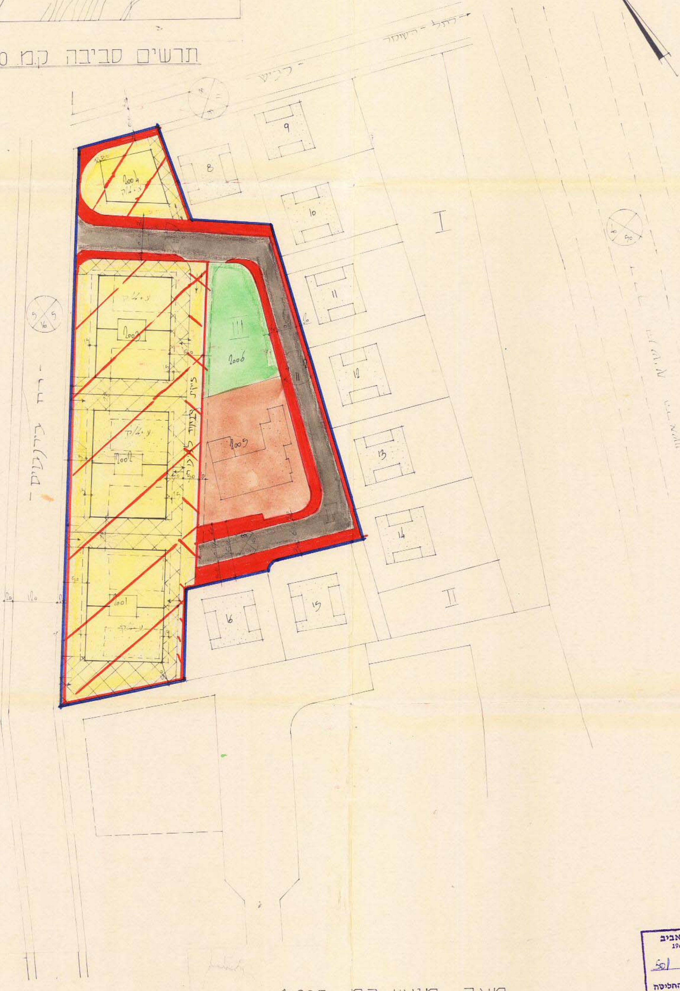
מצב מוצע קמ 1:625

שדר התכנית: אדריכל לאון אושקי רחוב ישיעהו 2 בני ברק טל. 03-5702568 מס' רישון 27033 יוזם התכנית: הועדה המקומית לתכנון ובניה בני-ברק בעל הפרקע: מנהל מקרקעי ישראל המבצע: חב' פיתוח