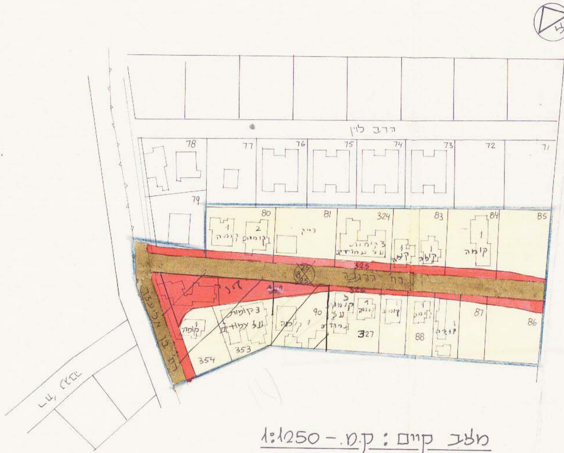
מלב קים: ק.מ. - 1:250