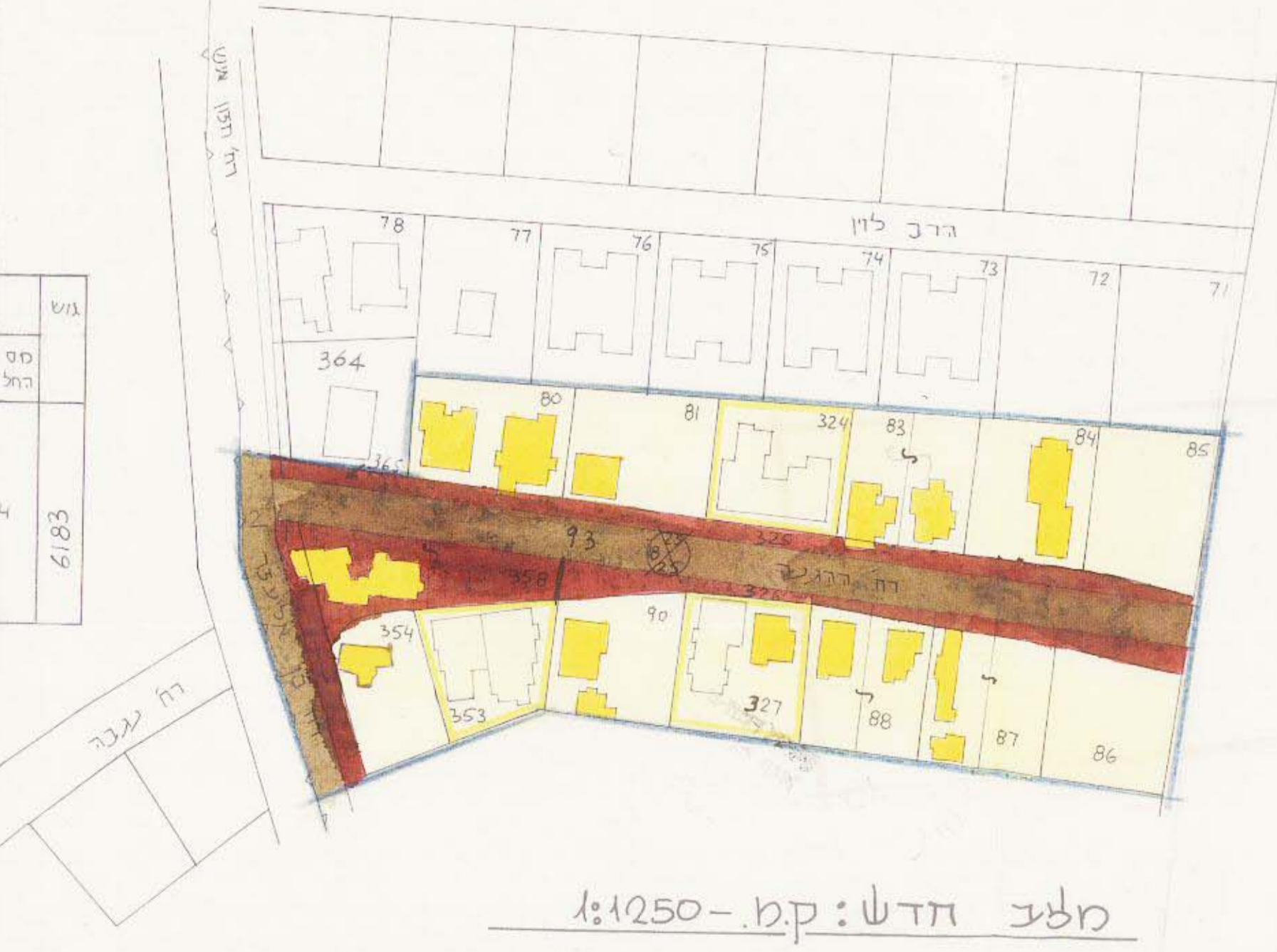
מלב חדש: ק.מ. - 1:250

מרחב תכנון מקומי רג' תשריט מצורף לתכנית מס' רג' 868 שינוי לתכנית המתאר רג' / 340 רג' / 340