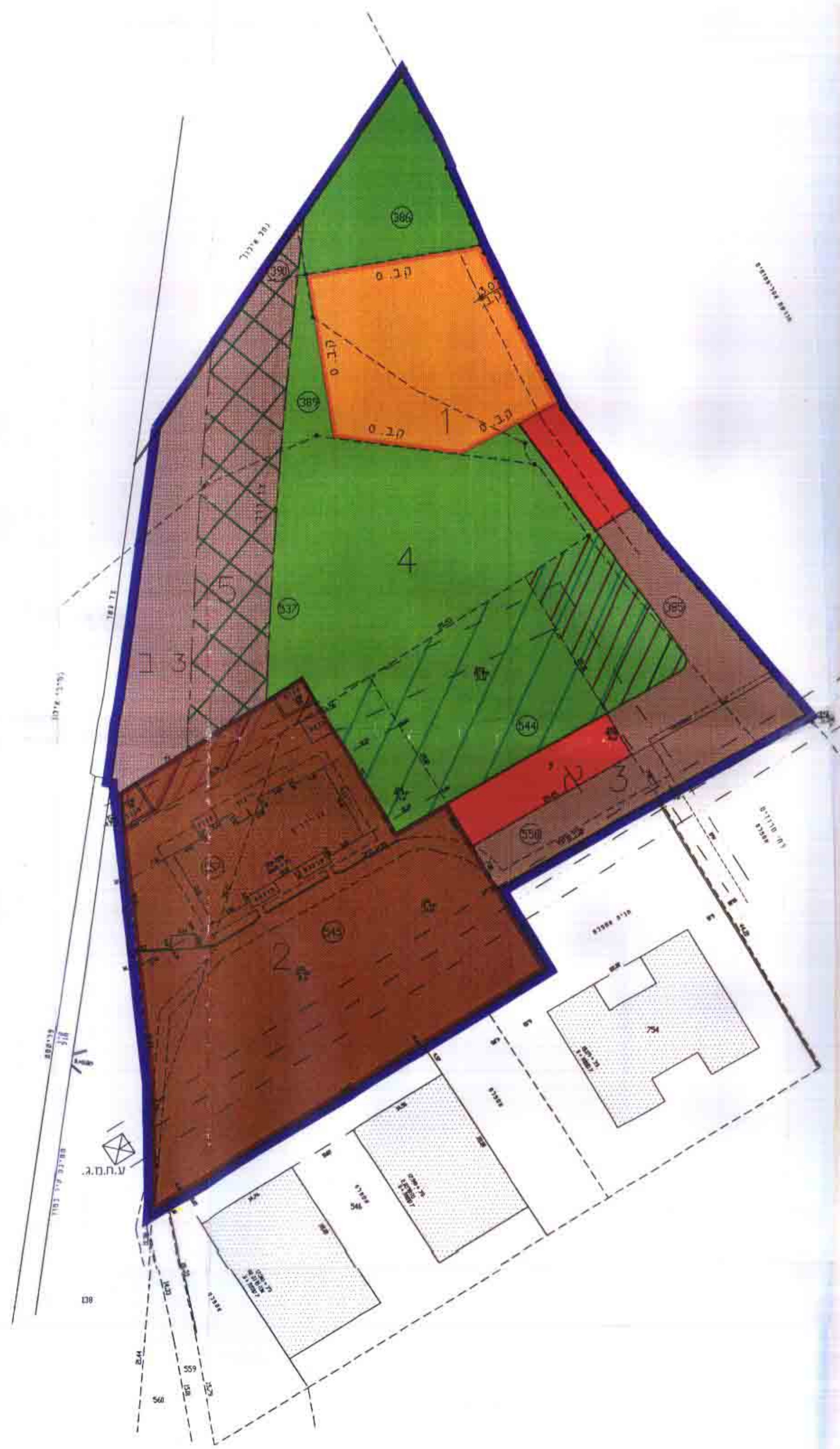
מצב מוצע ק.מ. 1:500