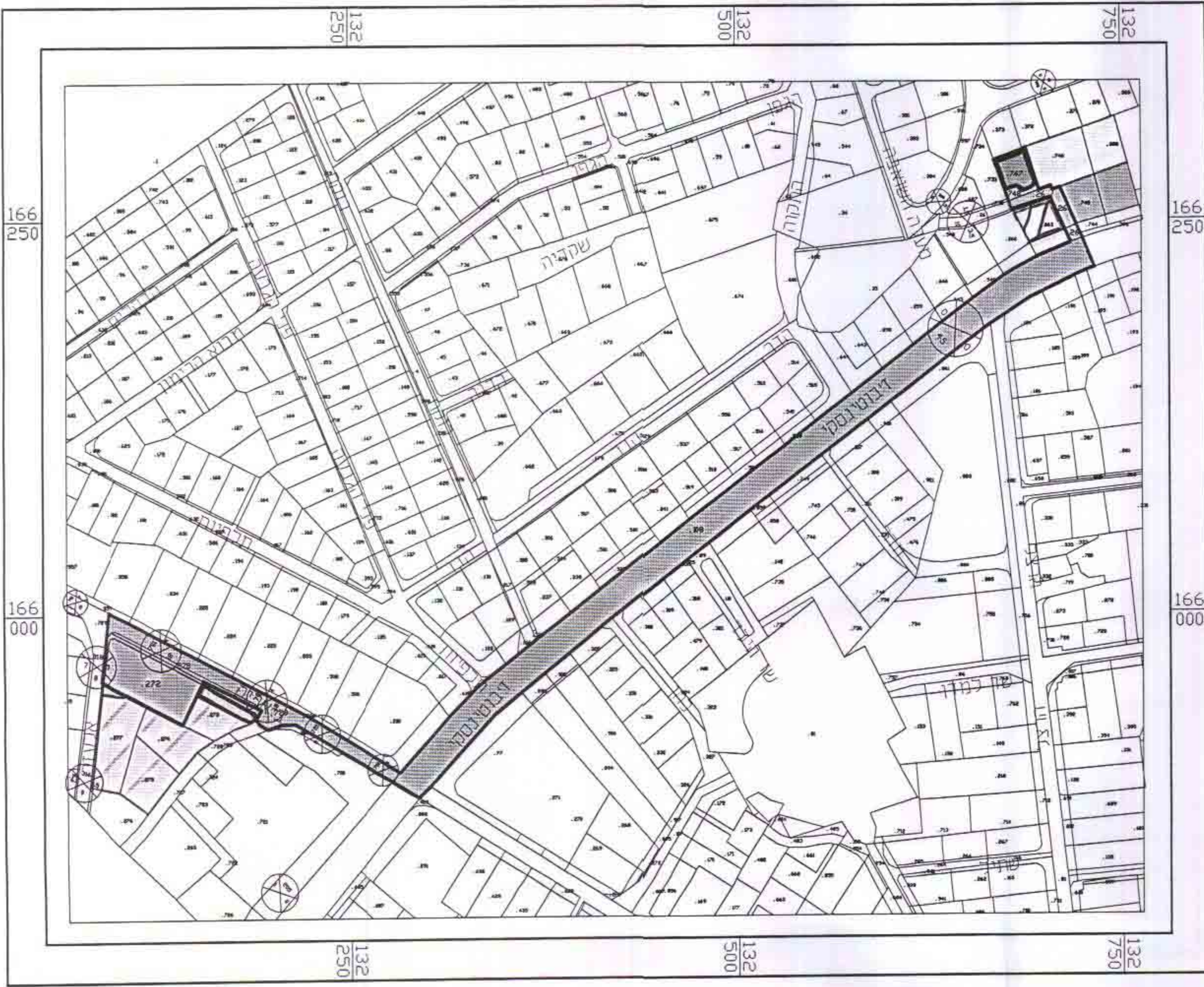
מצב קיים ותרשים הסביבה עפ"י ר"ג/791 א ור"ג/720 ור"ג/340 ק.מ. 1:2500