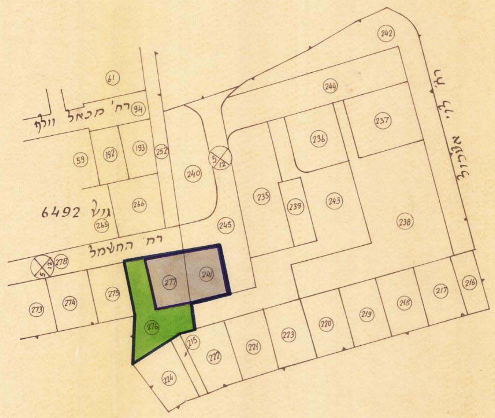
מצב קיים לפי ת.ב.ע. 101 קנה מידה 1:1250