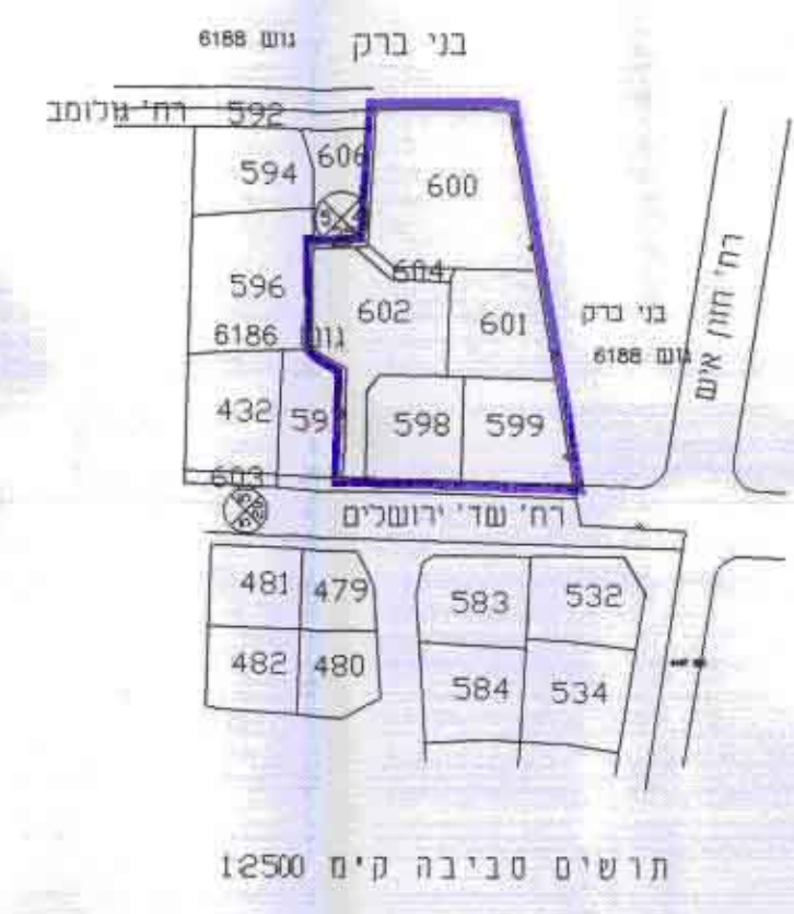
תושים סביבה קים 12500