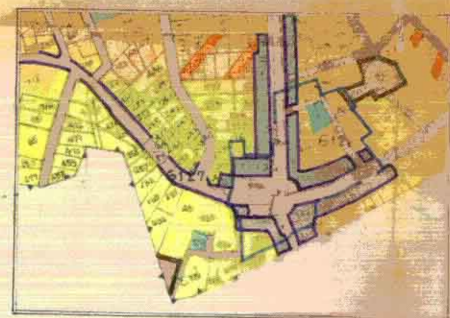
קיים לפי תכנית DE