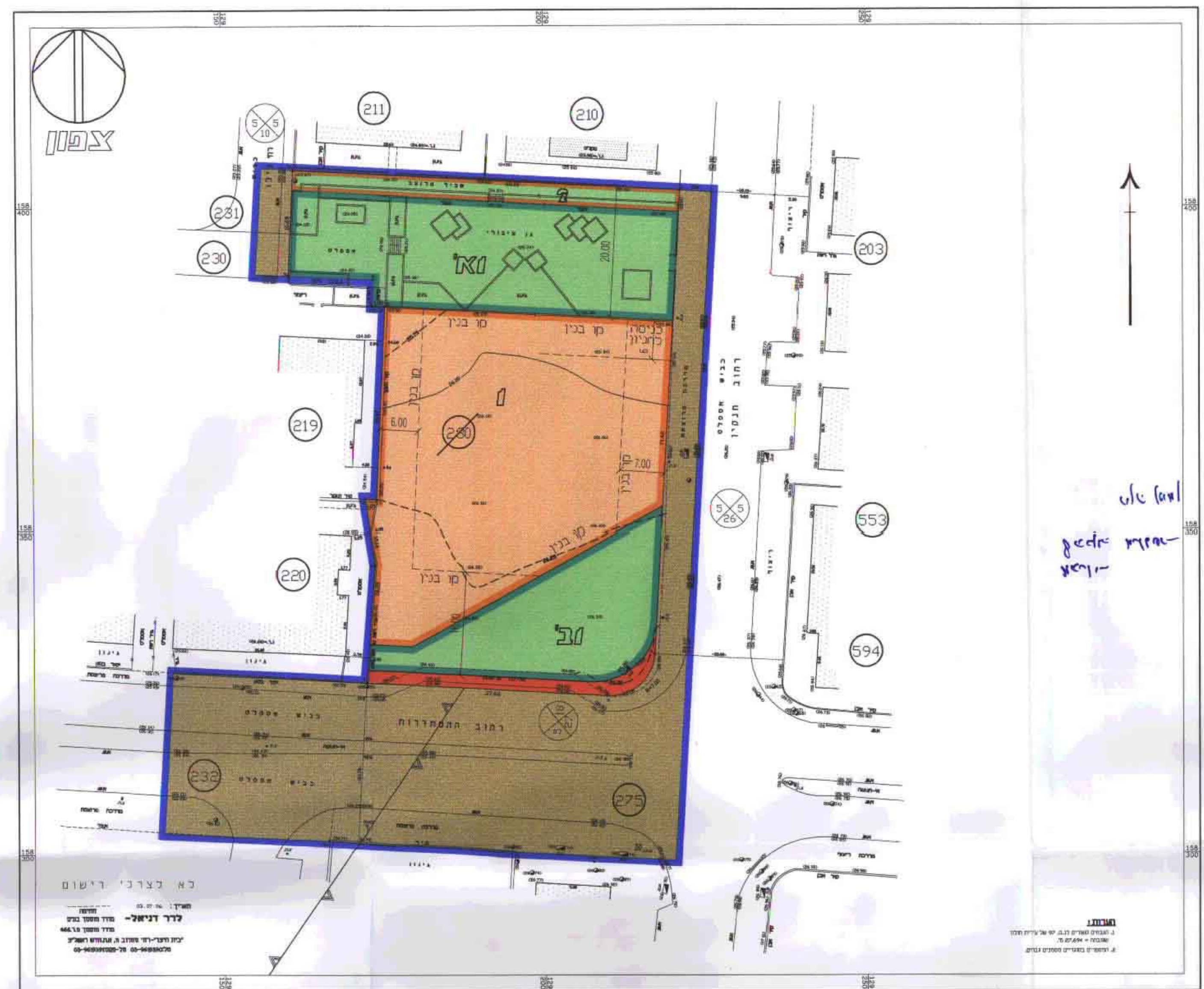
מצב הוצע קנ"מ 1:500