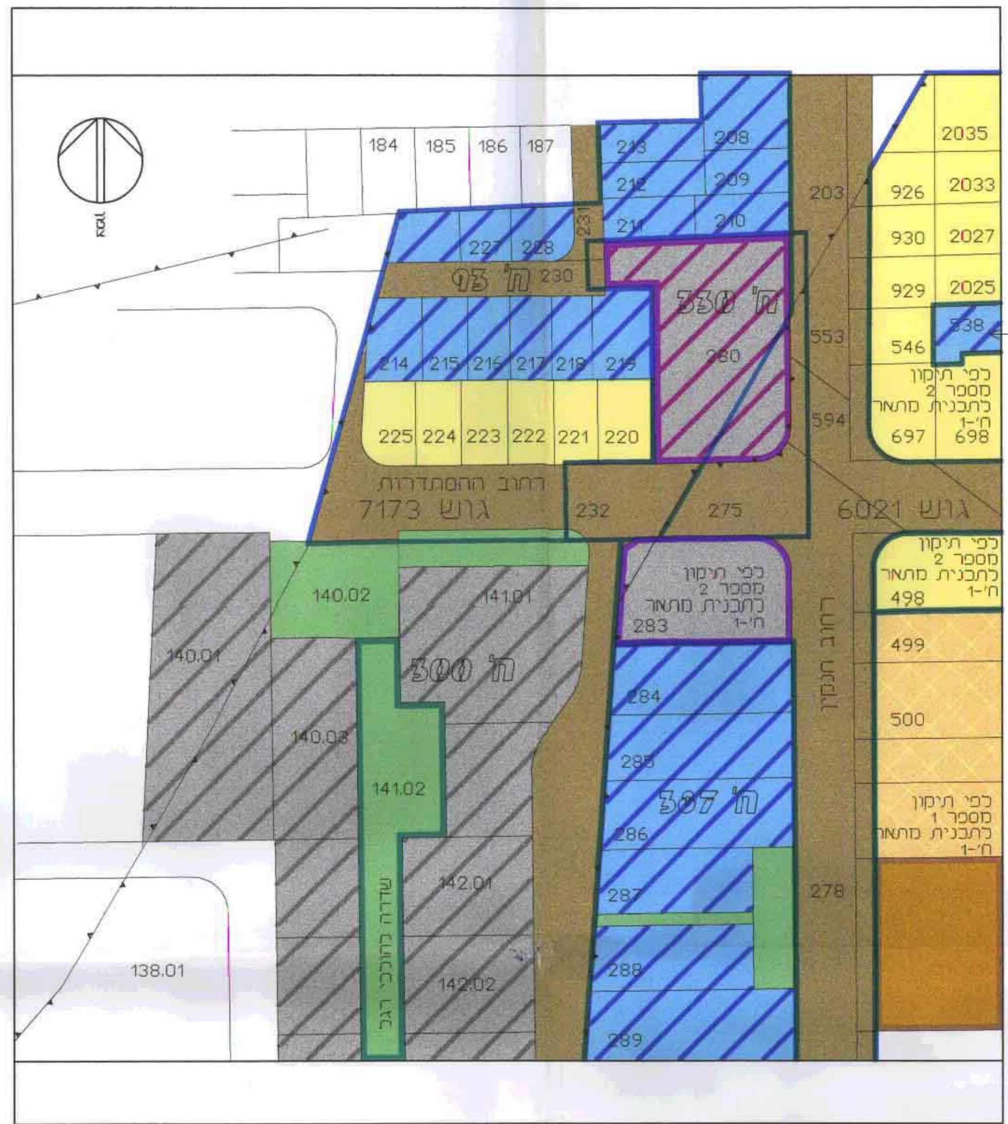
תרשימים הסביבה קנ"מ 1:1250