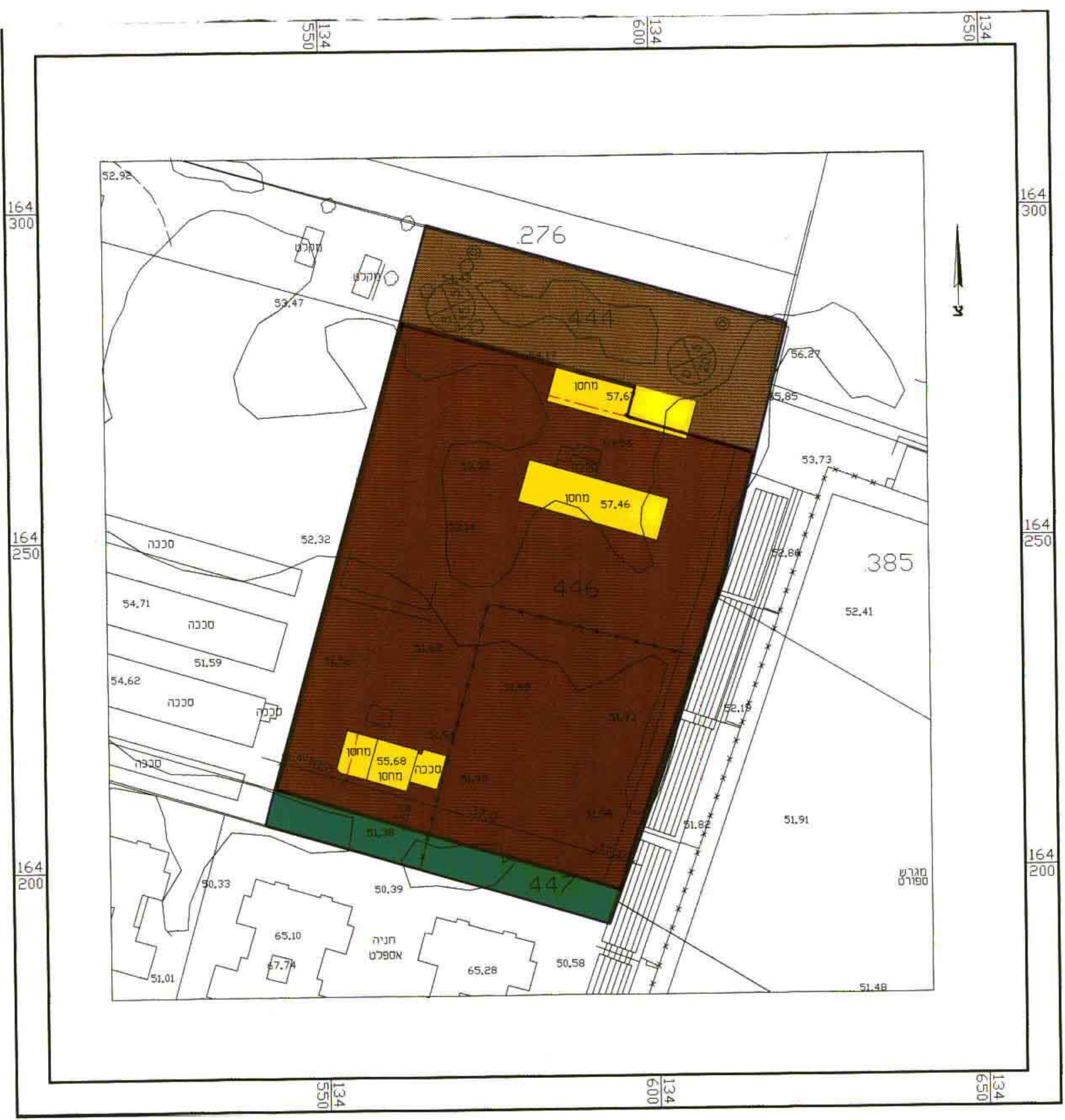
מצב מוצע ק.מ. 1:500