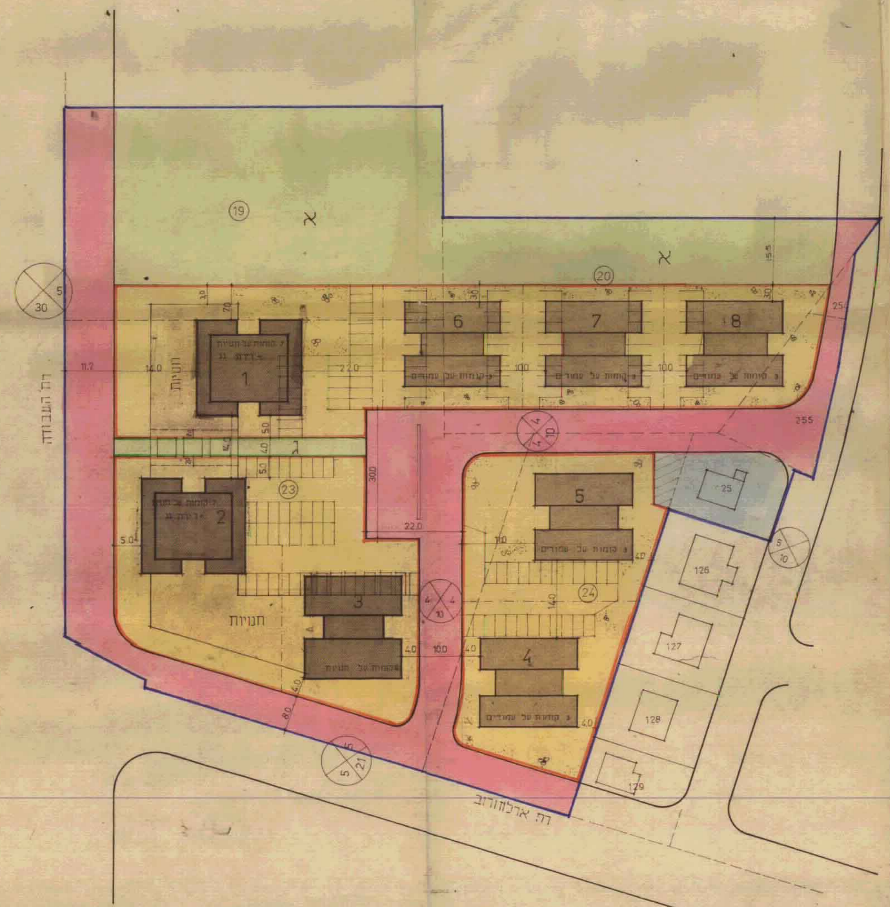
תכנית מצב מוצע ק.נ.מ 1:500

מסדרי הקיום חוק התכנון והבינוי תשנ"ה-1965 מס' 1955 מס' 1955