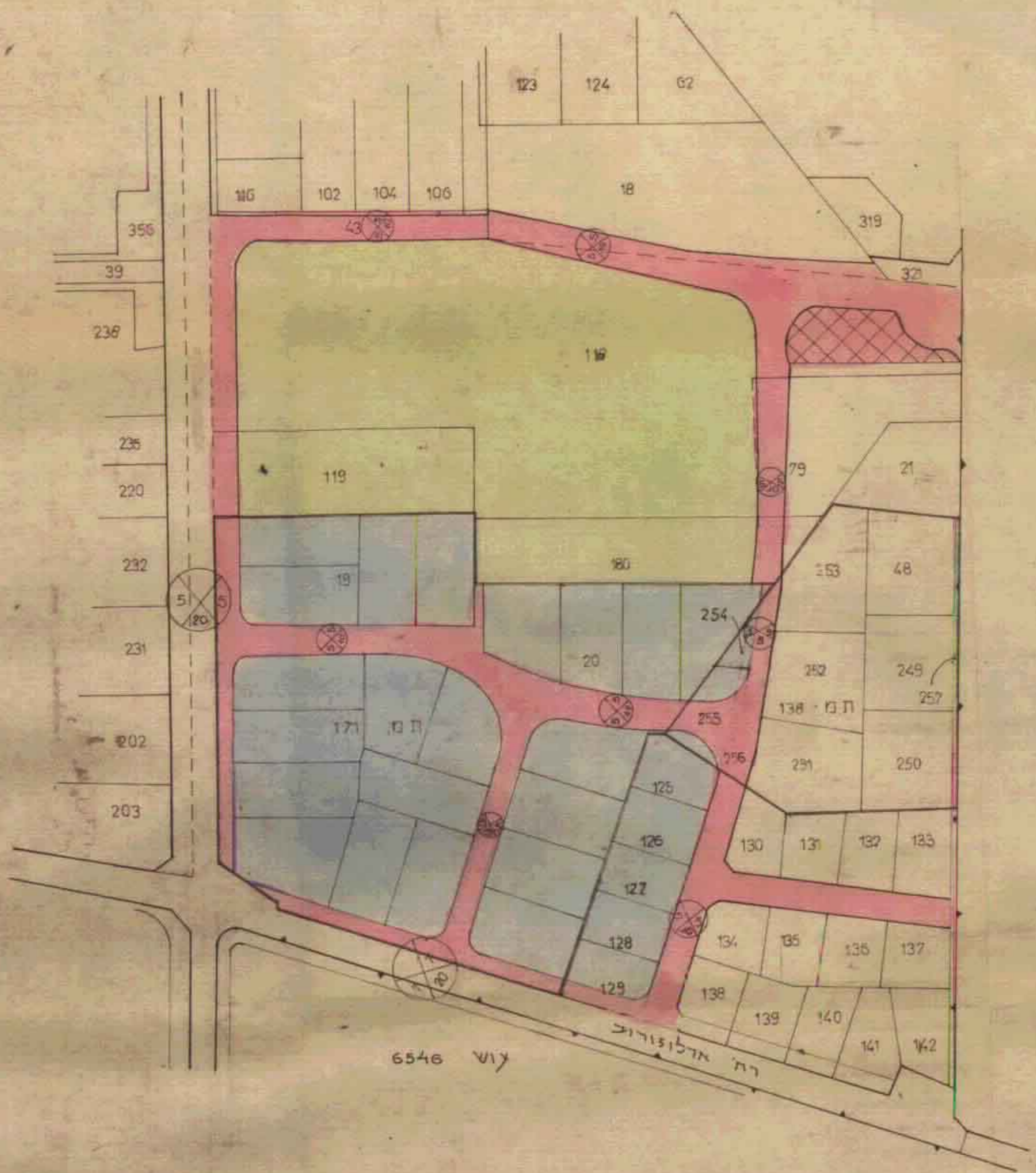
מצב לפי תכנית מתאר א' 253 ק.נ.מ 1:250