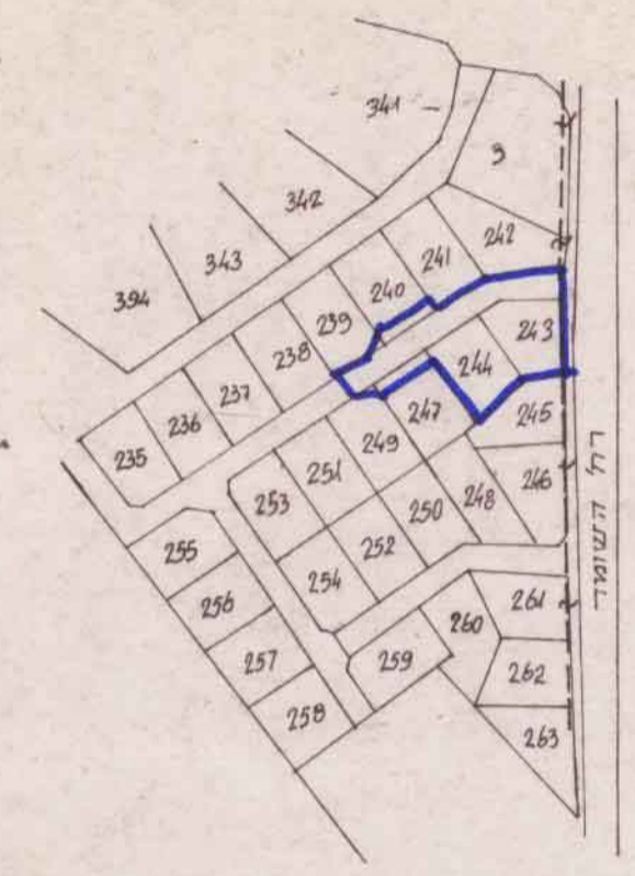
תרשים הסביבה ק"מ 1:2500

הועדה המקומית לבנין ובנין ערים, בני ברק תכנית מס' 371 לשם אזור 371 תאריך: 27.12.78 הועדה המקומית לבנין ובנין ערים, בני ברק תאריך: 27.12.78 לשם אזור 371 תאריך: 27.12.78