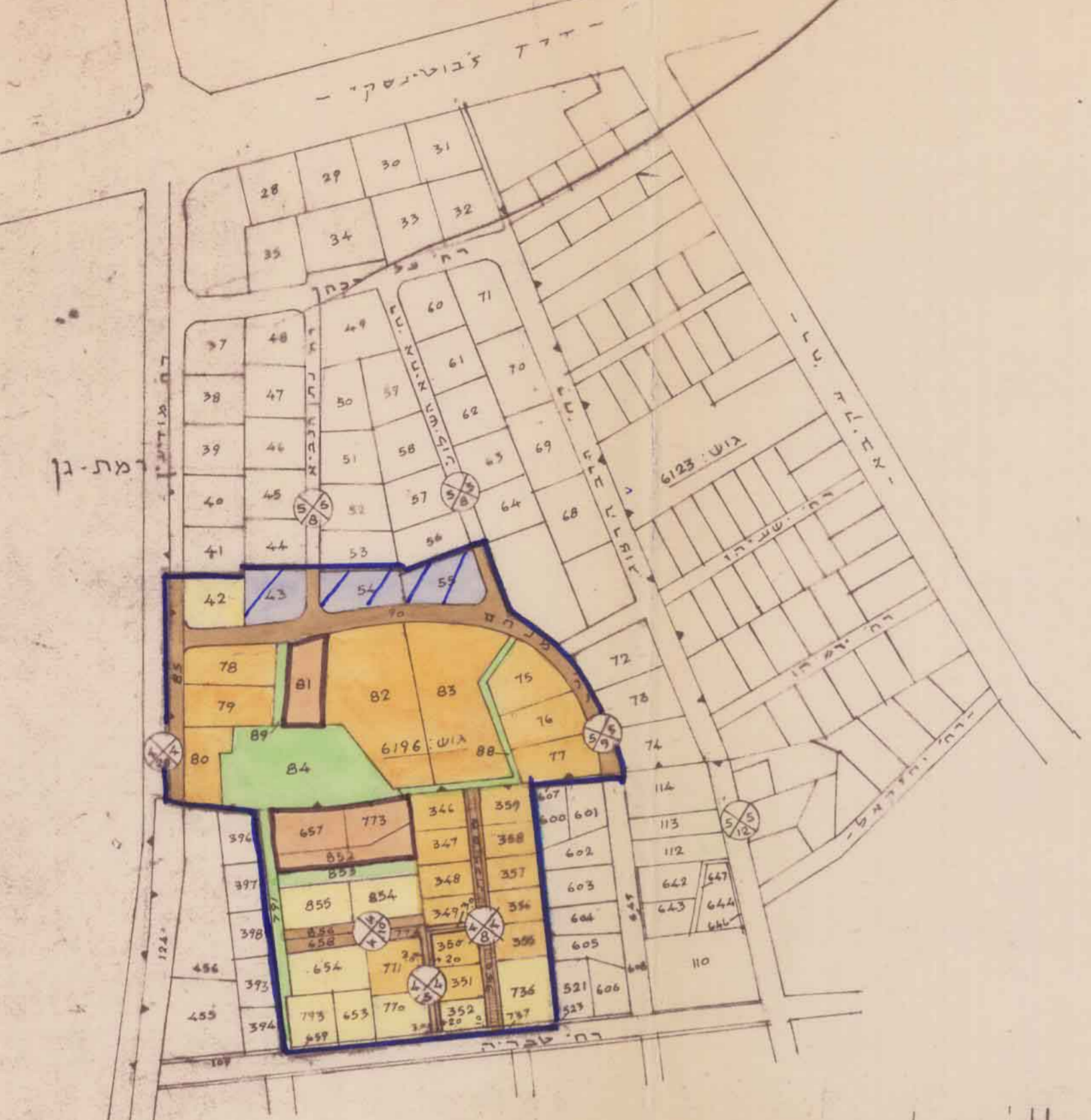
תרשים הסביבה ומצב קיים 1:2500

מחוז : תל-אביב נפה : תל-אביב-יפו עיר : בני-ברק גוש : 6123 : חלקות : 856-852, 791, 774, 773, 771, 770, 737, 736, 659-657, 654, 653, 360-355, 352-346 גוש : 6196 : חלקות : 85, חלק 85, חלק 84, 87, 88, 84, 78, 77, 75, 55, 54, 43, 42 היזום : הועדה המקומית לתכנון עיר בני-ברק המתכנן : מהנדס העיר שטח התכנית : 37148 מ"ר