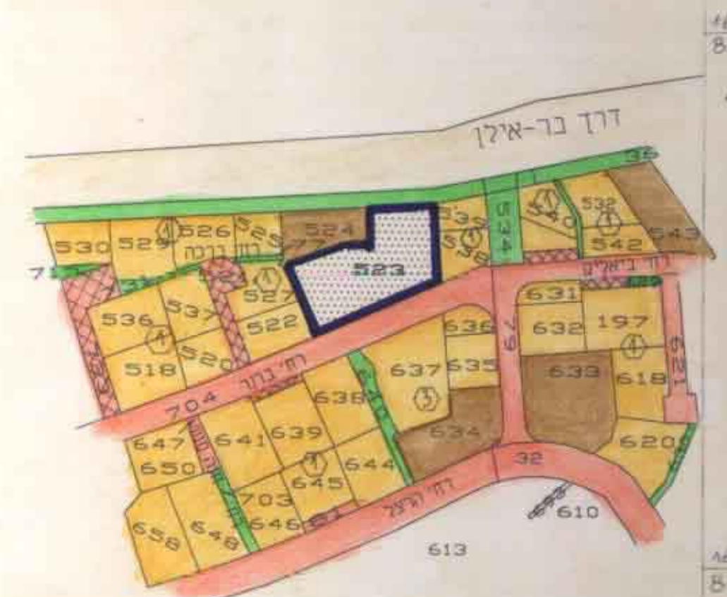
תרשים הסביבה 1:2500