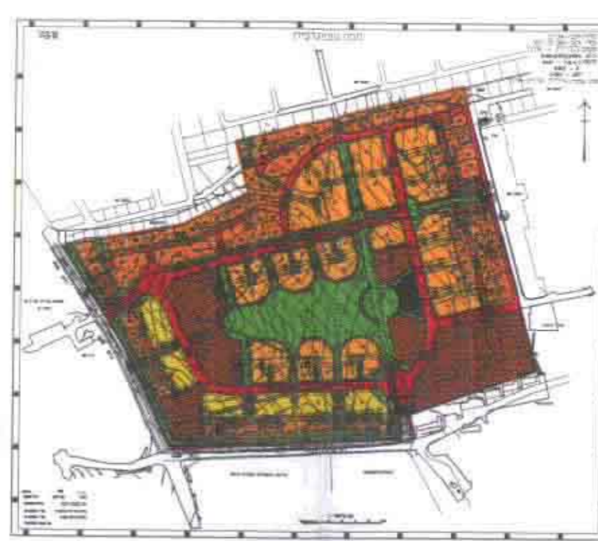
תרשים סביבה קנ"מ 1:10000

שטח התכנית : 79.83 דונם בעלי הקרקע : שונים היוזם ומגיש : הועדה המקומית לתכנון ובניה אונן עורך התכנית : אדריכל יפתח הררי החשמונאים 1 ת"א טלפון - 03-6748439