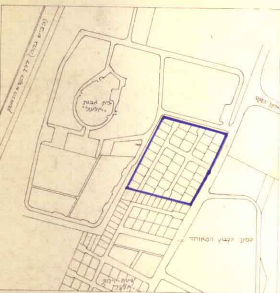
תרשים לסביבה קב" 1:5000