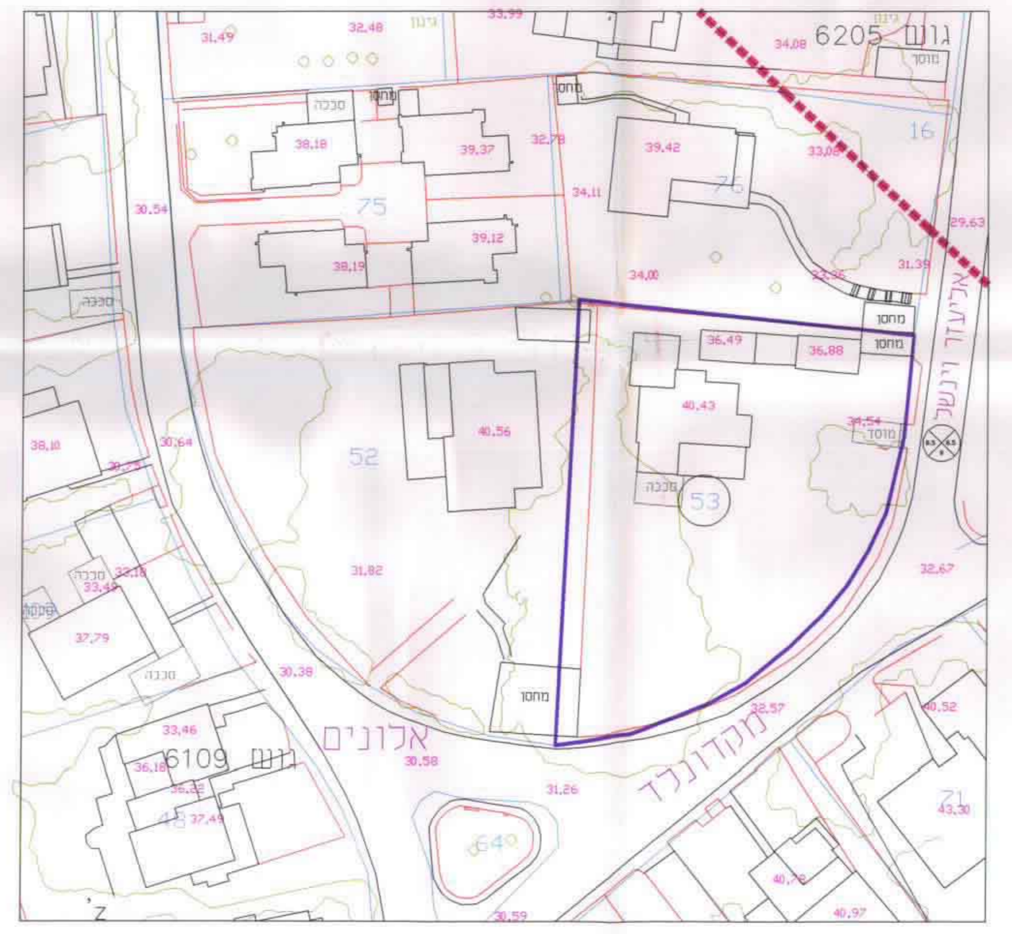
חרשים סביבה ע"פ רקע g i s ק.מ. 1:500